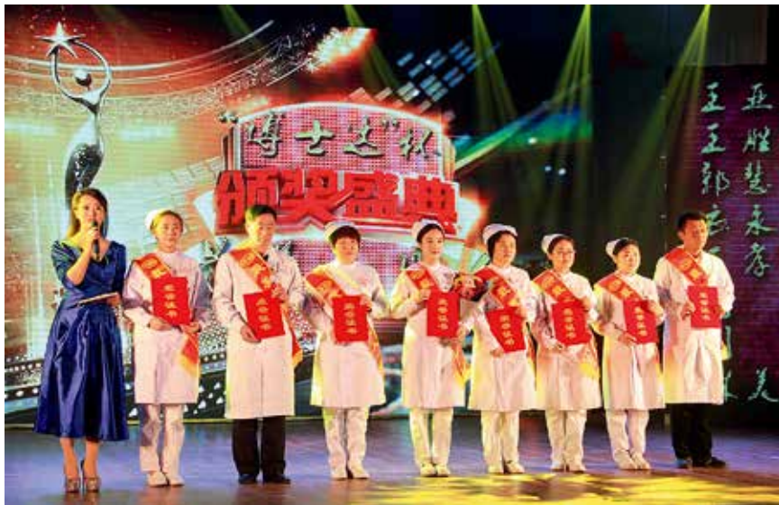
栖霞市人民医院 180 秒生死救援团队获首届“最美栖霞人”称号

【“码上栖霞”】 10 月 16 日，栖霞市政府联合蚂蚁金服打造的全国首个“码”上城市平台——“码上栖霞”正式启动，在此平台基础上打造的“码上联盟”同时启动。“码上栖霞”是基于支付宝、微信、城市 APP 等第三方移动平台，利用手机扫码技术打造出的一个属于栖霞政府的唯一城市二维码。当地市民可借助微信、APP 等含有扫码功能的软件，通过“扫一扫”即可享受便捷的政务服务、生活服务和金融服务。而“码上联盟”则是依托“码上栖霞”智慧城市平台的上线运营，联合当地各大企业、商圈、店家，打造的属于栖霞的无现金联盟，通过利用可开放共享的大数