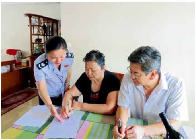
2017年8月22日，市地税局牟平分局为行动不便老人上门办理二手房交易手续

【税收服务】 年内，全市地税系统开展便民办税春风行动，连续第四年进行春季企业走访调研，走访企业118户，实地了解企业办税需求，形成具有针对性的税收服务措施。推行网上办税为主、自助和其他社会办税为辅、实体办税服务厅兜底的办税模式，提高办税效率。推广应用山东地税电子税务局，在烟台地税微信公众号增加办税功能，实现办税预约、手机申报、银联缴款、申报提醒、税收政策查询等多项便民功能。加强与国库、银行等部门协作，探索推广电子退税工作。梳理公布第一批“零跑腿”清单15项，“只跑一次”清单7项，实现非即办类业务前台受理、后台流转。落实税收优惠政策，为8129户小微企业减免所得税8617万元，为103户高新技术企业享受研发费用加计扣除额8.55亿元，为月销售额10万元以下的5.19万户纳税人减免教育费附加、地方教育附加及地方水利建设基金1326万元，为55户物流企业减免土地使用税2643.53万元，