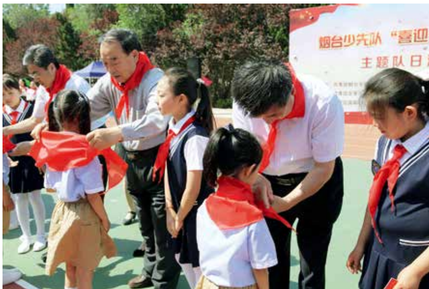
2017年6月1日，共青团烟台市委举办烟台少先队“喜迎十九大 我向习总书记说句心里话”主题队日活动暨新队员入队仪式