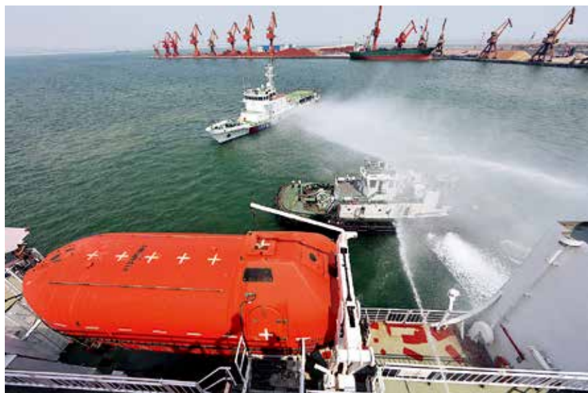
2017 年 6 月 15 日，烟台海事局在蓬莱组织开展大型客滚船综合消防演练

【服务经济社会发展】 年内，烟台海事局助力口岸开放，协调延长 19 个泊位临时开放期限，推动龙口港区新增涉外作业点通过开放验收；推行国际贸易“单一窗口”系统，组织实施国际航线船舶联合登临检查 10 次，进一步提高通关效率。服务长岛生态保护和持续发展，实施蓬长客运航线一体化监管模式，建立并运行“蓬长一体化动态监控中心”，全力支持蓬长航线在旅游旺季延长营运时间，长岛海事工作船码头和国家级海上