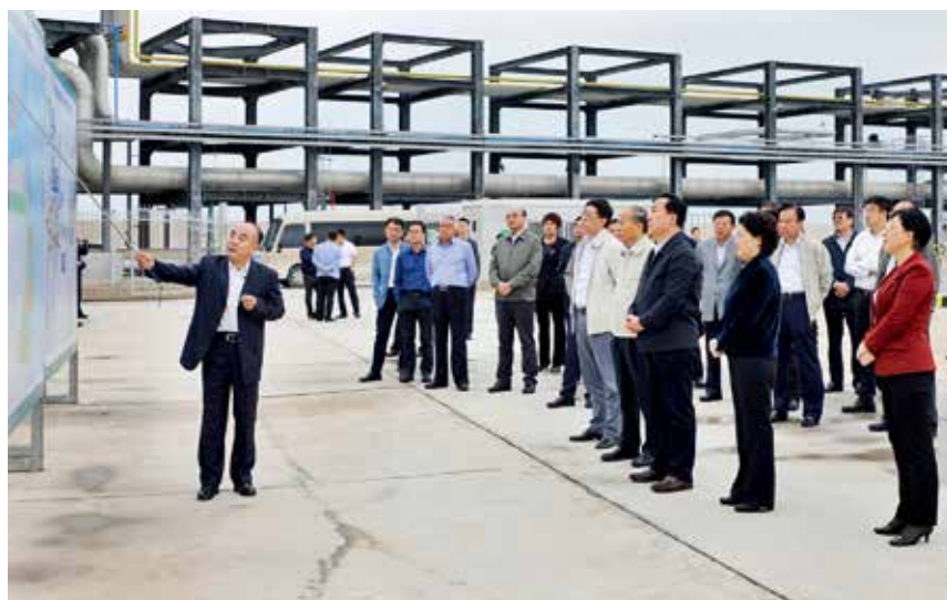
2017 年 10 月 10 日，市委、市政府在烟台港西港区召开港口建设现场办公会