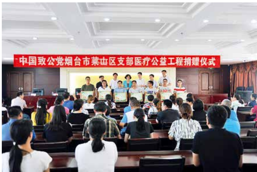
2017年7月7日，致公党莱山区支部为莱山区学校捐赠急救包

【概况】 2017年，九三学社烟台市委辖3个基层委员会，18个直属支社，5个直属小组。社员总数545人，平均年龄55岁，具有高级职称的社员占60%以上，70名社员具有博士学位，66人次担任各级人大代表、政协委员。年内，社市委获评九三学社中央“2013—2017年度参政议政工作先进集体”，参政议政工作、信息工作和思想宣传工作分别荣获九三学社山东省委二等奖。1名社员获评九三学社中央“坚持和发展中国特色社会主义学习实践活动全国先进个人”，3名社员获评九三学社中央