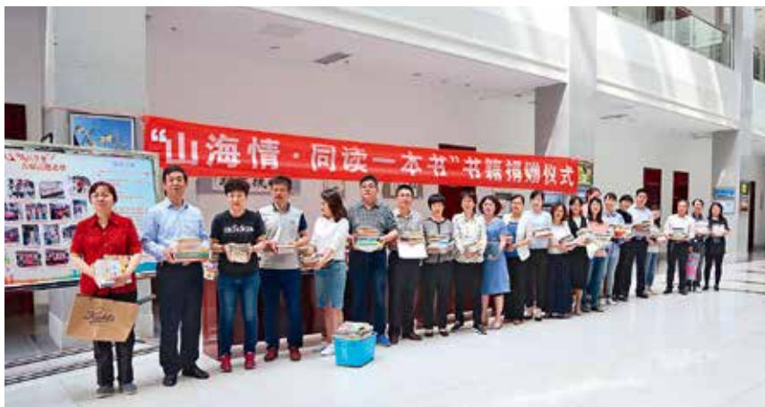
2017年5月18日,市委党校联合《烟台日报》发出“山海情·同读一本书”倡议书。图为图书捐赠现场

【干部培训】 年内,市委党校举办各类培训班35期,培训干部4100余人次,其中主体班次25期,培训学员3539人;与市内外有关单位、部门联合办班10期,培训学员520余人次。党的理论教育、党性教育的有效学习时间达到总课时的70%以上,其中党性教育的有效学习时间达到