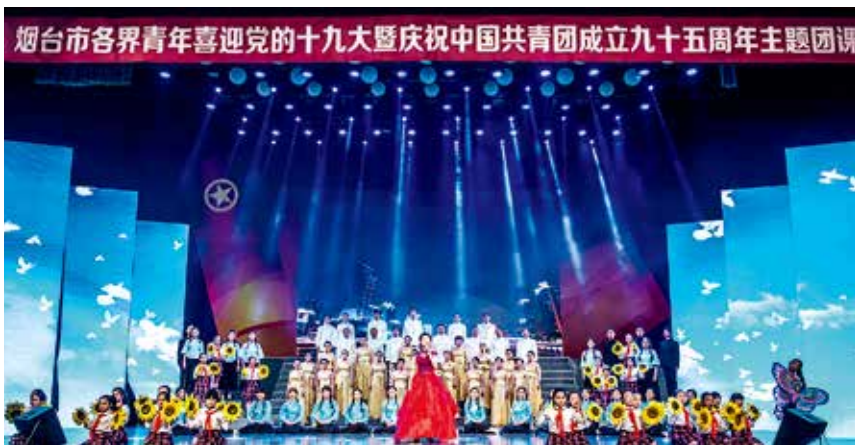
2017年5月3日，烟台市各界青年喜迎党的十九大暨庆祝中国共产主义青年团成立九十五周年主题团课在烟台电视台演播大厅举办

织235个。打造“青春源空间”“烟青e家·志愿益站”等青年活动平台，推进“青年之家”系统化、标准化建设，积极入驻云平台，实现镇街全覆盖。加强与青年社会组织及其骨干的定期联系、培训交流、项目合作，开展青年社会组织优秀项目评选活动，向市财政申请专项资金对25个青年志愿服务示范项目给予专项扶持。加强团员管理教育。实行发展团员总量调控，严格按照初、高中阶段毕业班团青比例分别控制在30%、60%以内的要求，学校、县市区团委、团市委严格审核计划数，做好团员发展工作，保持合适的团青比例。加强团员先进性教育，严格组织生活，严肃团内执纪，宣传中学生团员先进典型。推进“一学一做”教育实践常态化制度化，开展“不忘初心跟党走”入团仪式、“让爱与生命永续”社会实践、“团员先锋岗（队）”创建等活动。完善少先队工作体系，制发《烟台市少先队员证》，实现档案化管理。