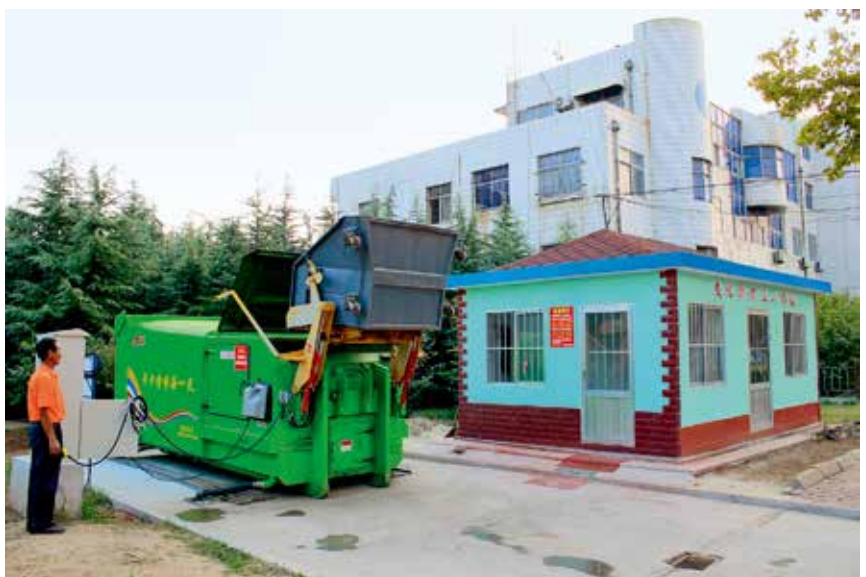
居民区小型垃圾压缩站