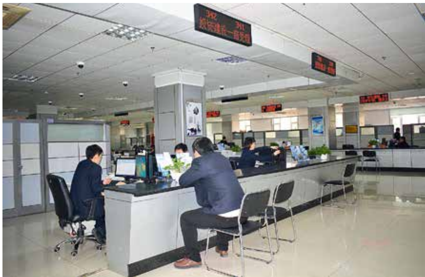
烟台市政务服务“一窗受理”窗口

【办事流程优化】 年内，市政管办以“最多跑一次”为目标，与 20 个先进城市全面开展对标优化，从压减时限、简化环节、削减材料、深化网办等多个方面着手，减少服务对象跑腿次数，实现申报材料数 100% 最少、审批时限 100% 最短。将“零跑腿”和“只跑一次”事项，全部纳入网上政务服务平台，并逐项公开事项跑办次数，接受社会监督。10 月，市委、市政府组织十三路记者，对市政务服务中心“零跑腿”和“只跑一次”落实情况大规模暗访检查，群众普遍反映办事更加便利。11 月，烟台市企业家联合会、外商投资企业协会围绕“放管服”工作组织问卷调查和座谈，企业家们普遍认为“中心”审批服务效率大幅提高。