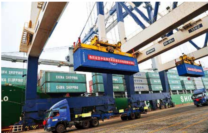
2017年12月15日,中远海运集装箱远洋船舶首航烟台

严”、化工产业转型升级、反恐工作和环境保护突出问题专项整治等活动为主线,对全市港航生产经营企业实行“实名制”“网络化”管理,杜绝安全生产失控漏管问题发生;强化极端恶劣天气预警预防工作,严格落实客滚船“逢七不开”和客运站、危化品码头“逢七不作业”制度;发挥水路客滚实名制售票检票系统、滚装安全信息共享系统、安检信息管理系统、客滚视频监控系统和旅客人身、行包安检仪和车辆大型安检仪的作用,实现对旅客和车辆在登船前、登船中和登船后的全程有效监管;围绕港口危险货物作业、港口设施保安等工作重心,在不同港区组织开展大型港口设施保安应急联动演习和多次专项应急训练,港航应急处置能力不断提高;制定《烟台市港口和船舶污染物接收转运及处置设施建设方案》,并以市政府文件出台;禁止柴油车运输集疏港煤炭于8月底在全市所有港口开始实施,比国家和省里要求提前一个月完成任务。