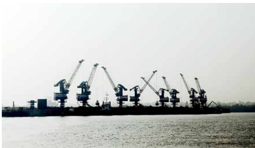
2017年11月4日,中交航务公司顺利完成几内亚博凯内港码头工程二港区4#泊位主体施工任务

龙口港区。10万吨级航道拓宽工程通过竣工验收;货场回填工程完工;24#泊位改造工程加紧施工,力