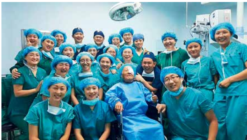
2017年9月，“光彩点睛光明行”活动在海阳市举行，为100名贫困白内障老人免费实施手术

【新的社会阶层人士统战工作】 年内，市委统战部在全省新的社会阶层人士统战工作会议上作大会发言，召开全市新的社会阶层人士统战工作会议。开展全市调研，推荐新的社会阶层党外代表人士306名，推荐全省代表人士25名。芝罘区1861文化创意产业园被确立为省级新的社会阶层人士统战工作实践创新基地，打造福山、龙口等6处市级实践创新基地，莱州、招远社会组织联合会正式成立。在新的社会阶层组织开展“新阶层·党旗红”活动，组织代表人士参加全省新的社会阶层代表人士培训班、网络代表人士培训班，并召开社会组织联合会首届年会。