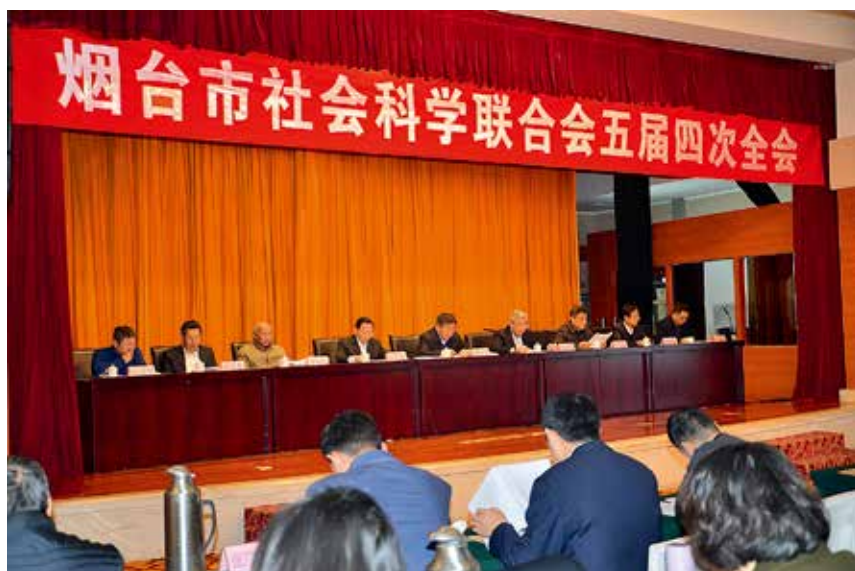
2017年12月28日,烟台市社科联五届四次全会召开

【服务经济社会】 2017年,市侨联利用节会和对外经贸活动加强与海外的沟通联谊,接待来自10多个国家和地区的670多人次的海外客人。5月,中国侨联经济科技部赵红英部长、省侨联梁波主席一行来烟考察烟台申报的中国侨联创新创业基地,先后考察高新区、吉林大学烟台产业园和开发区留学生创业园区。8月,承办中国侨联、省侨联“海外侨胞故乡行—‘一带一路’沿线国家侨领走进山东”活动,70余位侨领来到烟台蓬莱进行实地考察,并参加在当地举