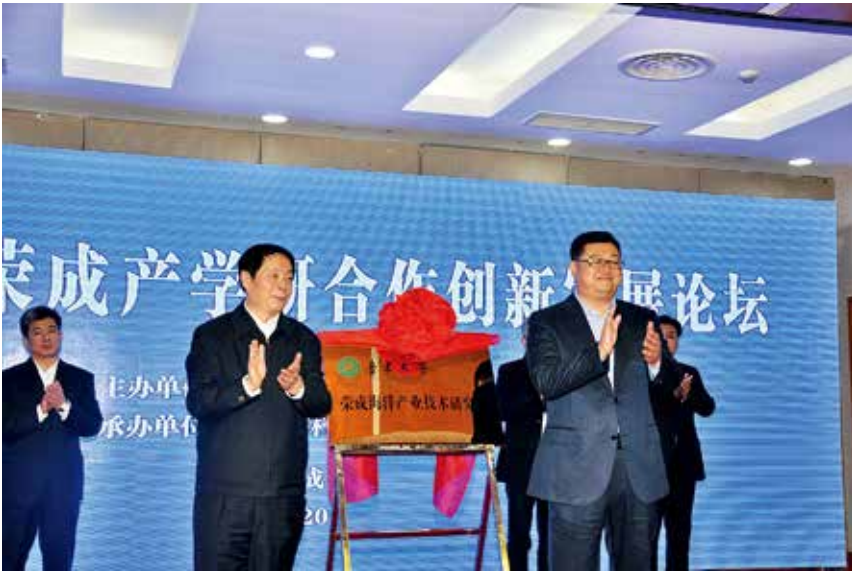
2017年11月20日，鲁东大学荣成海洋产业技术研究院揭牌仪式举行

提升，其中工程学发展潜力值增长到1.014。实施学位点建设标准化工程，加强学位点建设，入选省立项建设博士学位授予单位，新增硕士学位授权点数量位居全省高校第二名。推进博士人才培养项目建设，做好期满验收准备工作。