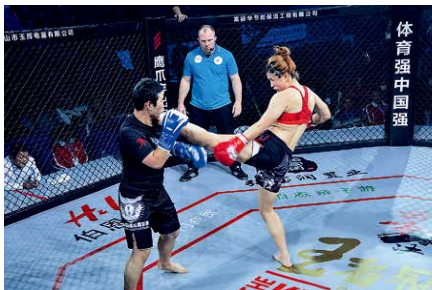
2017年12月23日，“云峰对决·王者冠军赛”在烟台市体育馆举行