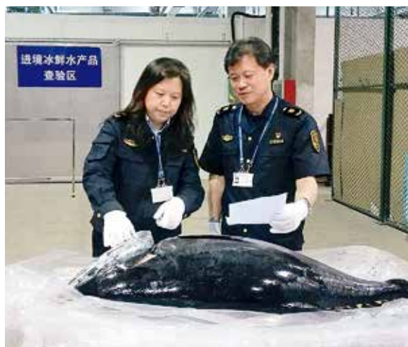
2017年5月17日，烟台机场口岸首次进口冰鲜金枪鱼

周期管控，平均实验室检测周期同比缩减27.2%。截至12月份，进出境平均流程时长同比缩短15.4%，分别比全省平均流程时长低38.28%、37.06%。