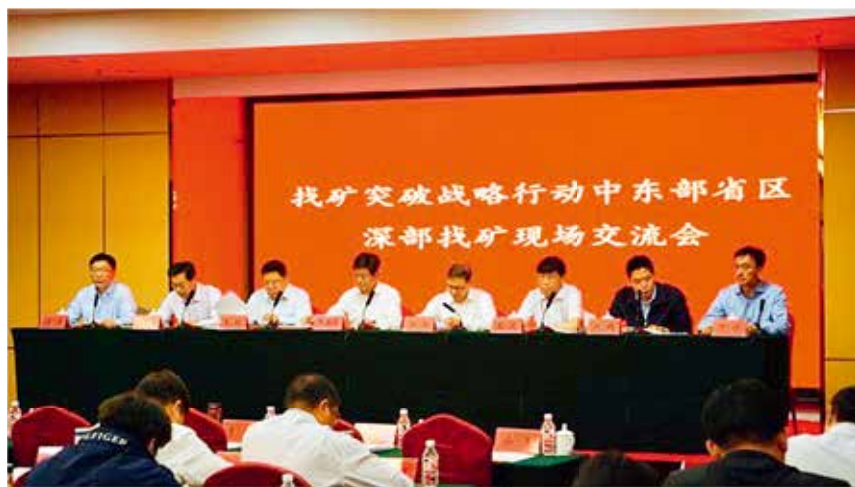
2017 年 5 月 4 日，国土资源部在莱州市召开找矿突破战略行动中东部省区深部找矿现场交流会

【测绘管理】 年内完成国土资源“一张图”数据中心、电子政务平台、综合监管平台和共享服务平台四大平台建设。国土执法监察系统建设项目和“一个平台、两个市场”建设项目同时获 2017 中国地理信息产业优秀工程银奖。安排财政资金近 400 万元开展芝罘区、莱山区、高新区的 1:500 大比例尺基础地形数据修测及地理实体建库工作。进一步完善全流程网上审批系统及监管机制，新增划拨地商品房出让业务、征收土地公告审批、省发证矿产资源储量登记审批、勘查报告储量估算初审等 10 多个业务审批流程，共计受理报件 1300 多件，按时办结率达 94%。“天地图·烟台”成功接入天地图国家主节点。数字烟台地理信息公共服务平台应用范围进一步拓展，市级平台累计为 25 个部门的 47 个系统提供在