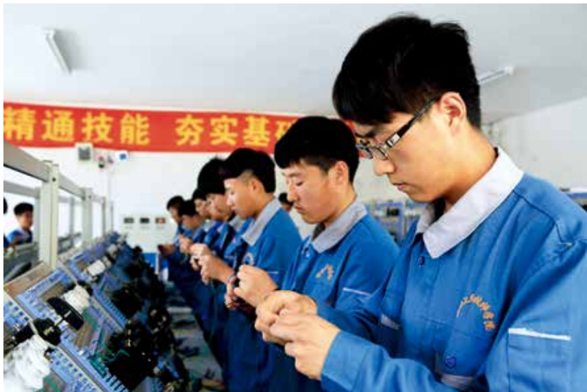
烟台工贸技师学院机电技术应用专业学生进行技能比武

【济南大学泉城学院】 教学科研工作。确定财务管理、机械设计制造及其自动化、影视摄影与制作和环境设计 4 个专业作为学校首批优势特色专业，建设时间为 2018—2020 年。完成 2017 版专业人才培养方案的修订编制工作。2017 年完成省部级项目 4 项立项工作，获得教育厅教学研究立项 1 项，教育部 2017 年校企协同育人项目立项 3 项。在科研方面，完成校级科研项目立项及历年延期课题结题工作。2016 年立项课题 27 项，16 项结题，其余待结题或延期；2015 年 4 个申请延期课题中，2 项予以结题。完成校级科研项目立项工作。经专家组审定，32 个申报项目中，22 个项目获准立项，其中包括科研项目 5 项、教研项目 17 项。2017 年 16