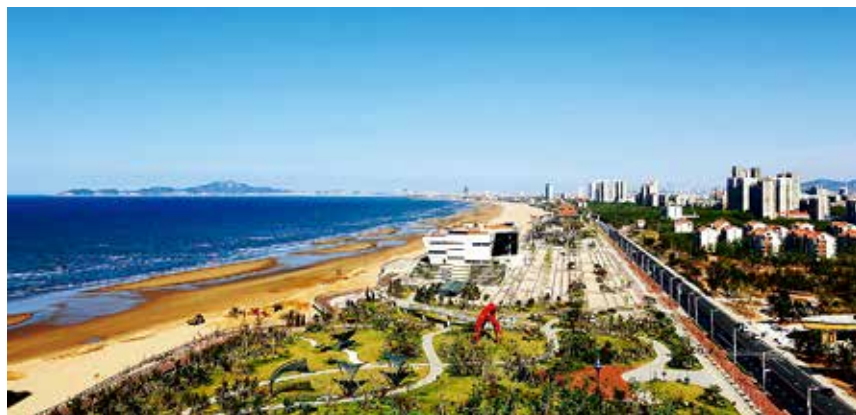
烟台经济技术开发区海滨新城

值0.01亿元，下降96.8%；牧业产值2.1亿元，增长0.4%；渔业产值27.4亿元，增长8.6%。渔业产值占农林牧渔业总产值的76.6%。