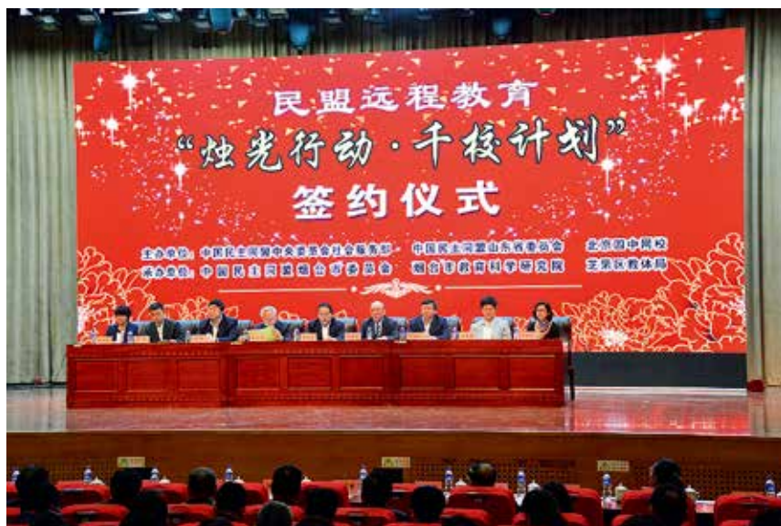
2017年4月20日，民盟烟台市委承办民盟远程教育“烛光行动·千校计划”签约仪式

【社会服务】 年内，民盟烟台市委促成并承办“民盟远程教育‘烛光行动·千校计划’签约仪式暨2017年中国基础教育信息化论坛”启动仪式，活动共向烟台市17所学校捐赠价值近700万元的教育教学资源。“中国民主同盟烟台市委员会同心·健康服务基地”在烟台成友中医院揭牌，开展各类义诊活动合计28次，健康知识讲座26次，举办接诊1760人次，慰问救助困难家庭3次。“文化、