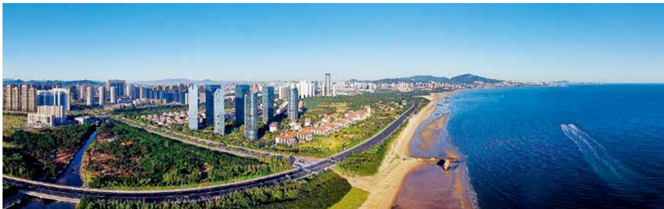
烟台高新技术产业开发区全景图

【产业发展】 2017年8月信息技术产业发展推进中心、高端服务业发展推进中心、医药健康产业发展推进中心、海洋新兴产业发展推进中心、航空航天产业发展推进中心、智能制造产业发展推进中心、节能环保及新材料产业发展推进中心、国际产业合作推进中心等8个产业发展推进中心和产业发展推进委员会办公室成立,推行重点项目服务专班等工作机制,制定出台《关于强化招商引资工作加快培育烟台高新区主导产业的实施意见》《关于支持区内现有企业做大做强做优的政策措施》,构建从项目引进、建设到生产、运营,具有吸引力和竞争力的政策体系。招商引资快速突破,以新旧动能转换重大工程为引领,依托已有产业基础、骨干企业和在谈优质项目等条件,确定医药健康、数字经济、海洋新兴、航空航天、智能制造、节能环保及新材料、高端服务业7个产业主攻方向,兵港科技信息安全产业园、艾多美总部、烟台影像医联体中心等总投资260亿