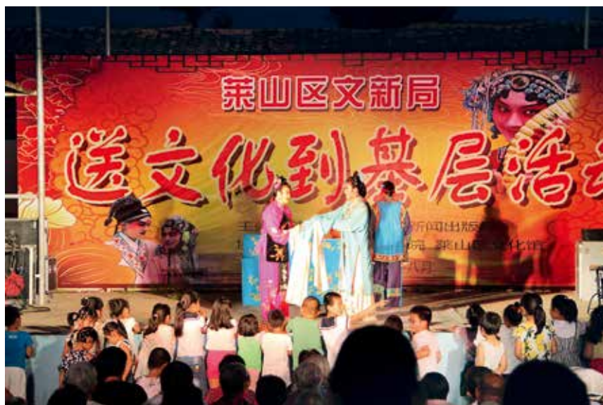
莱山区送文化到基层演出活动

【建设环保】 年末,城镇化率100%。城市基础设施建设完成投资45000万元。城市人均绿地面积22.7平方米,建成区绿化覆盖率43.41%。自