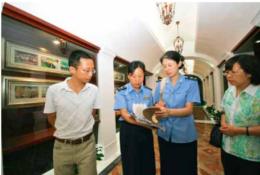
工作人员为企业提供上门服务

项目代办联席会议制度，完善代办工作机制，对全市重点项目提供分类归口代办。年内为德龙烟铁路等 178 个项目提供代办服务，其中重点项目 66 个，投资额 313 亿元。