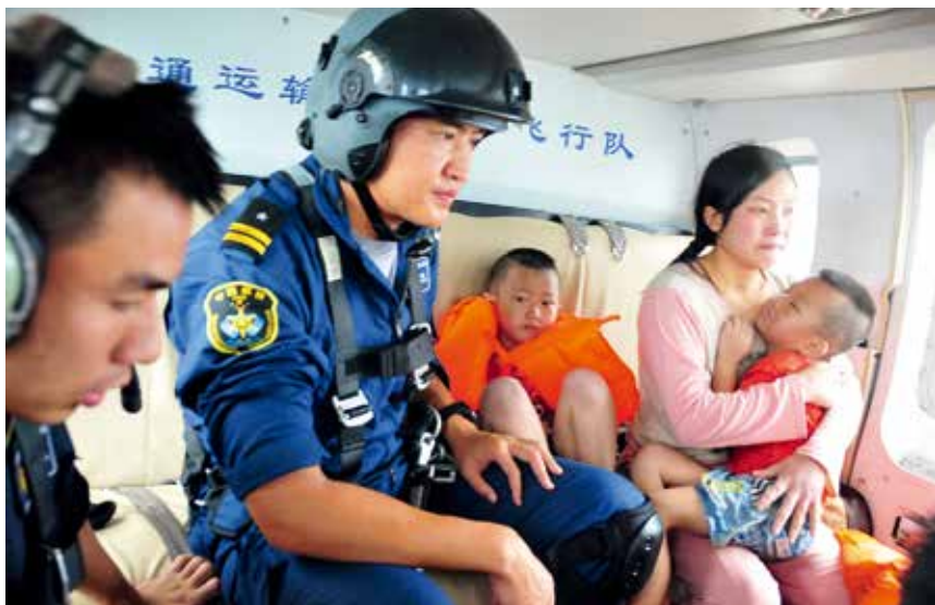
2017 年 7 月 21 日，“北海救 115”轮、“北海救 117”轮、救助直升机“B7309”在滦河口附近成功救助沉没工程船“mingxing18”轮 5 名遇险人员

【海上救助概况】 2017 年，交通运输部北海救助局（以下简称北海救助局）组织救助力量完成值班待命 6615 艘天，出动 578 艘/架/队次，执行救助抢险打捞任务 404 起，挽救 398 名遇险人员，使 29 艘中外船舶