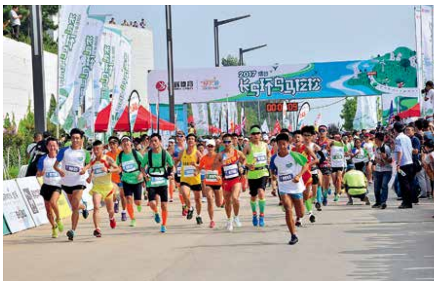
2017年9月2日，烟台长岛环岛马拉松举办