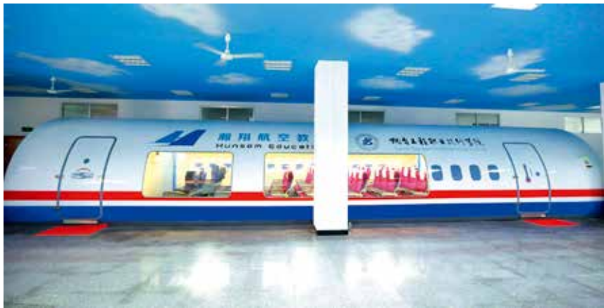
2017年7月8日,国内首个具有《民航乘务技能实训证书》考证功能模块的空乘服务综合训练舱在烟台工程职业技术学院建成并投入使用

【烟台汽车工程职业学院】 学院占地75公顷,建筑面积30.5万平方米,教职工746人。全日制在校生12301人。设汽车制造工程系等9个教学系(部),开设汽车制造与装配技术等34个专业,有省级品牌专业群2个,省级特色专业3个,院级特色专业11个,院级品牌专业3个,省级精品课程16门,院级精品课程61门,院级精品资源共享课程10门,省级教学团队3个,省级教学名师2名,汽车名企培训师20名,山东省突出贡献技师1人,齐鲁首席技师1人,烟台市首席技师1人,烟台市突出贡献技师2人,烟台市技术能手3人。学院建有3.5万平方米的实训中心,校内实训室124处,仪器设备总值8753.32万元,校外实训基地250处。学院先后与北京现代、博世、一汽大众、金岭汽车、巴斯夫、保时捷、戴姆勒、捷豹路虎等42家汽车行业龙头企业建立深度校企合作关系,建立定向班、冠名班,校企携手共同培养高素质技术技能型人才。学院是教育