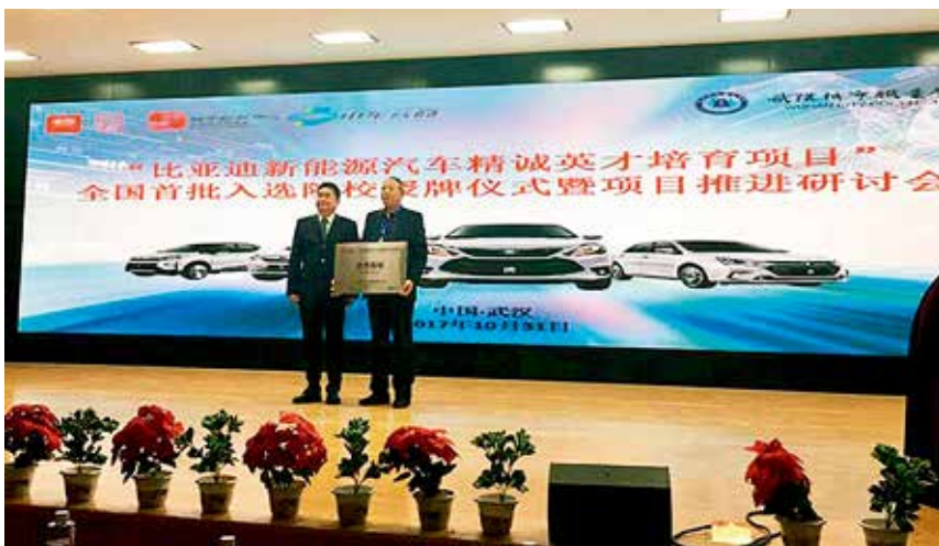
2017年10月31日，烟台汽车工程职业学院入选全国首批“比亚迪新能源汽车精诚英才培训项目”合作院校

专业建设。学院开设机电工程系、车辆工程系、应用技术系、旅游经济贸易系、烹饪技术系5大系部29个热门专业。专业设置涉及机械制造、电工电子、汽车装配与维修、餐饮服务、商贸旅游、信息技术等6大产业领域，新增工业机器人应用与维护等专业5个，形成特色鲜明、符合市场需求的专业结构。2017年上半年，学院成立由行业企业名家、职教名师组成的7个专业（专业群）建设指导委员会，对学院的专业建设把脉、定位。学院有省级重点名牌专业1个，省级重点专业1个，院级特色专业2个，全省一体化教学改革试点专业1个，学院一体化教学试点专业