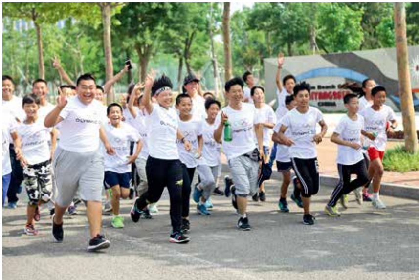
2017 年 6 月 18 日, 海阳市举行中国奥委会第 31 届奥林匹克日长跑活动