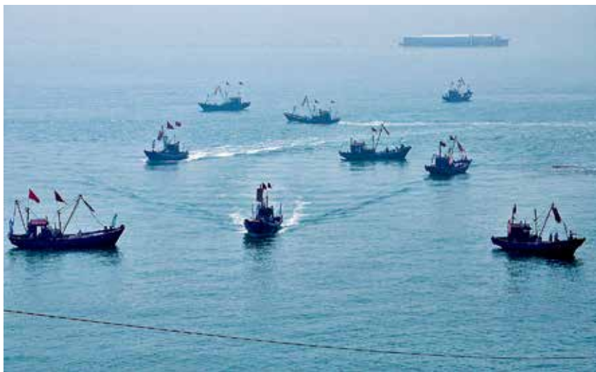
2017 年 9 月 9—10 日，“长岛旅游杯”2017 年全国海钓锦标赛（山东长岛站）在猴矶岛海域开赛

【教科文卫体】 中等职业、技工学校 1 所，在校生 95 人。普通高中 1 所，在校生 950 人；九年一贯制学校 2 所，在校生 1560 人；小学 3 所，在校生 214 人；教学点 4 处，在校生 17 人。幼儿园 9 所，公办 1 所，民办 1 所，部队 1 所，村或村联办 6 所，在园幼儿 673 人。专利申请 26 件，文化馆 1 处，公共图书馆 1 处，档案馆 1 处。广播、电视人口覆盖率均达到 100%。有卫生机构 13 所，其中，医院、卫生院 10 所，疾病预防控制机构 1 所，妇幼保健机构 1 所。各类卫生机构共有床位 220 张，卫生技术人员 274 人，