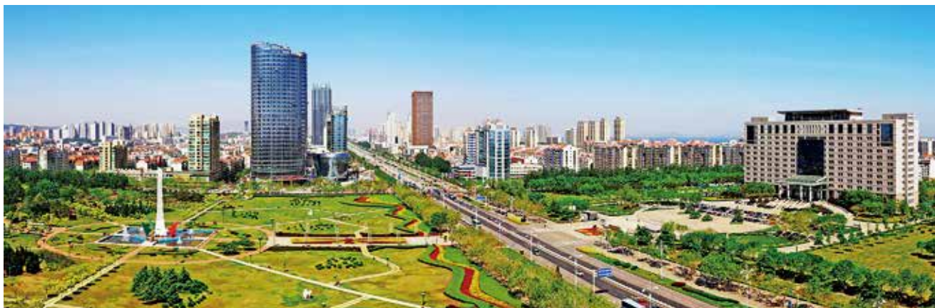
烟台经济技术开发区现代化经济中心

美元,占地9.3公顷,总建筑面积21.8万平方米,主要建设综合百货超市、电影院、各类专卖店、餐饮、娱乐等。