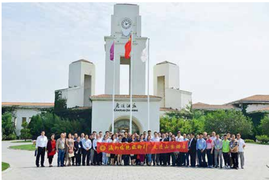
2017年8月30日，烟台市侨联承办中国侨联、省侨联“海外侨胞故乡行——‘一带一路’沿线国家侨领走进山东”活动

办的“投资环境推介会”。注重招贤引智工作，全市侨联系统引荐海外智力人才来烟讲学、开展学术交流9人次。发挥侨联在服务创新驱动发展战略中的作用，中国侨联将开发区留学生创业园设立为“中国侨联新侨创新创业基地”。搭建县市区侨联与驻烟高校侨联的联络平台，龙口市侨联、栖霞市侨联、芝罘区侨联、海阳市侨联与鲁东大学侨联、滨州医学院侨联、烟台大学侨联加强联系沟通，就引进人才和企业技术指导等方面达成共识，促进优秀人才与当地企业的有机对接。