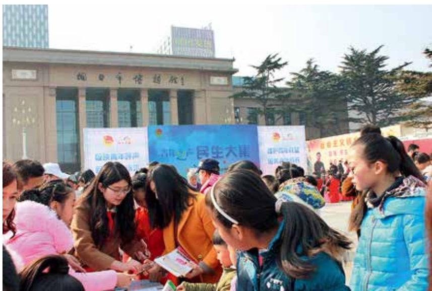
2017年3月4日，由共青团烟台市委主办的“三五”学雷锋志愿服务集中宣传活动暨第三届“青年之声·民生大集”在市文化广场举行

【从严治团】 年内，团市委成立改革工作领导小组，多次组织召开改革专题会议，市级改革方案以及全市12个县市区改革方案全部印发实施。运用培训宣讲、媒体宣传等多种形式，引导各级团干部和广大团员青年进一步理解、支持、参与改革。与市委组织部联合下发《关于做好县乡团委换届工作的通知》，推进县市区配齐配强工作力量。“青年之声”“智慧团建”“专挂兼干部队伍打造”等重点改革事项推进有序。同步推进青联、青企协、学联、少先队改革工作。加强团干部队伍建设，推进“两学一做”学习教育常态化制度化，贯彻落实“三会一课”制度，组织开展集中学习20余次。持续开展“作风能力双提升”“三建三联”“走、转、改”大宣传大调研、“1+100”“机关开放日”“主题党日”等活动，引导广大团干部深入基层、走进青年。加强党风廉政建设，组织机关干部到烟台廉政教育基地进行党性教育，组织班子成员和中层以上干部签订《领导干部廉洁自律承诺书》，组织全体机关干部签订《权力运行廉政风险防控表》《排查防控表（岗位）》。加强团干部培训，各级团组织通过组织培训班、研讨班、选派人员参加上级培训等方式，培训团干部1000余人次。扩大团的组织覆盖面，着重扩大互联网、非公企业、社会组织等新兴领域团组织覆盖面，新建各领域团组