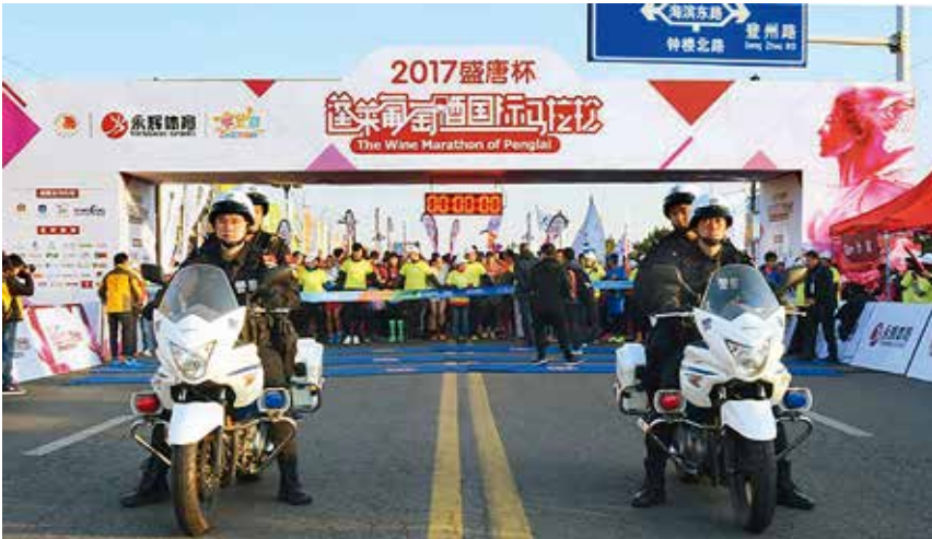
2017年11月12日，蓬莱市公安局执行“2017年蓬莱国际葡萄酒马拉松赛”安保任务

【大情报平台应用】 年内成立市局情报委员会，纳控情报平台重点群体472个、重点人员51942名，临控23400余人，车辆2500余台，抓获犯罪嫌疑人1300余人；红色指令抓捕612人，抓获率达73%。在全省情报合成研判追逃十佳精品案例、十佳技战法评选中，市局《三级三色分类筛选追逃技战法》取得技战法第一名、《抓获红追目标逃犯孙伟纪实》取得精品案例第五名；在全省情报综合研判比武中，烟台情报处荣获团体第一。自行研发的“321”系统被评为省内首创，“人员风险监测”“事件预警防范”功能被评为国内领先。