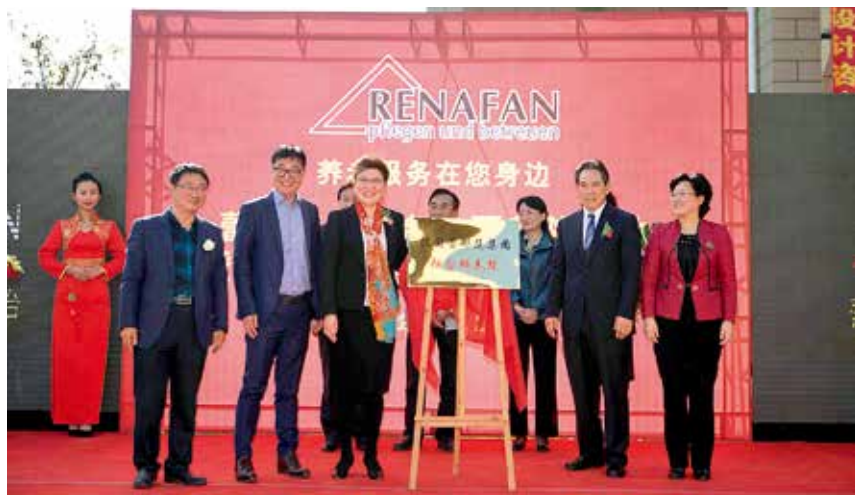
2017年3月14日，德国蕾娜范养老集团与烟台御花园老年公寓养老合作项目——德国蕾娜范御花园颐养院项目签约

【烟台首个专门针对失能半失能老人的中德合作专业护理项目】 3月14日，德国蕾娜范养老集团与烟台御花