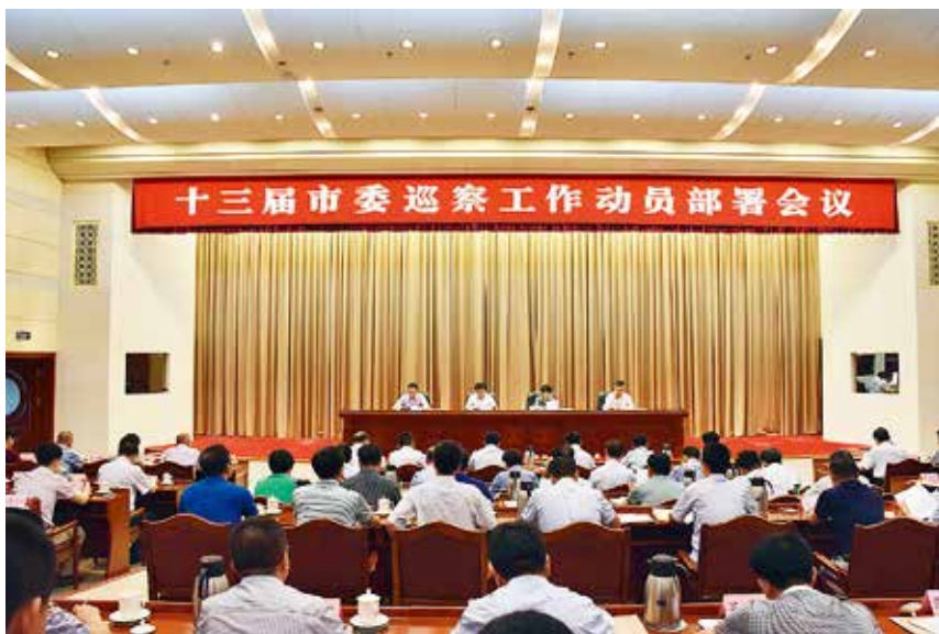
2017 年 7 月 31 日，十三届市委巡察工作动员部署会议召开

5 月 24 日至 25 日，省委常委、省纪委书记陈辐宽到烟台就贯彻落实中央纪委和省纪委会精神，深入推