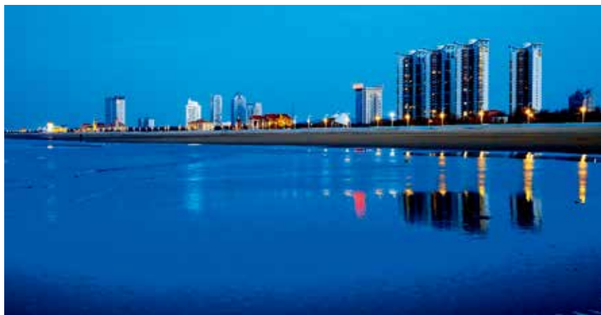
烟台经济技术开发区海滨夜色

【房地产项目】 永旺梦乐城项目 由永旺梦乐城株式会社投资建设，总投资 1.8 亿美元，注册资本 1.66 亿