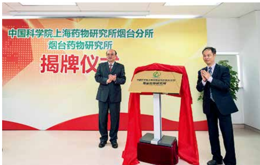
2017年4月24日，中国科学院上海药物研究所烟台分所暨烟台药物研究所揭牌仪式举行

【“慧聚烟台·圆梦中国”海外高层次人才烟台行活动在高新区举行】 9月23日至25日，“慧聚烟台·圆梦中国”海外高层次人才烟台行活动在高新区举行。医药健康、信息技术、航空航天、智能制造、节能环保