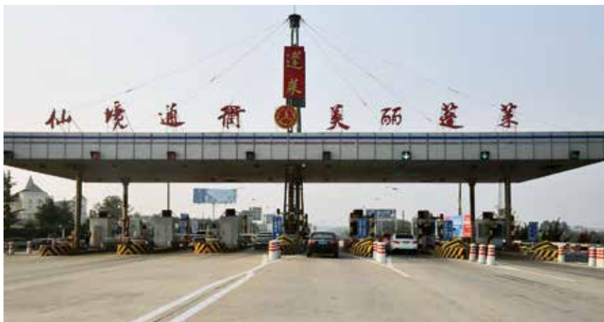
2017年10月30日,国道206蓬莱收费站提前两年撤站停止收费

蓝烟线图定货物列车27对、客车14对;青荣线图定动车40对。1月5日,青荣线增开列车2.5对(含高峰线2对):济南—荣成D9457/D9458次、荣成—青岛C6592/C6591次、济南—荣成D6073次;停运列车1对:济南西—荣成D6079/D6080次。4月16日,青荣线停运列车1.5对:青岛北—荣成C6555/C6570次、烟台—荣成D6099次;蓝烟线停运列车2对:郑州—烟台K1360/1 K1362/59次、烟台—菏泽K8278/5 K8276/7次;蓝烟线临时停运列车1对:汉口—烟台K1476/7 K1478/5次。7月1日,青荣线增开列车1对:青岛北—