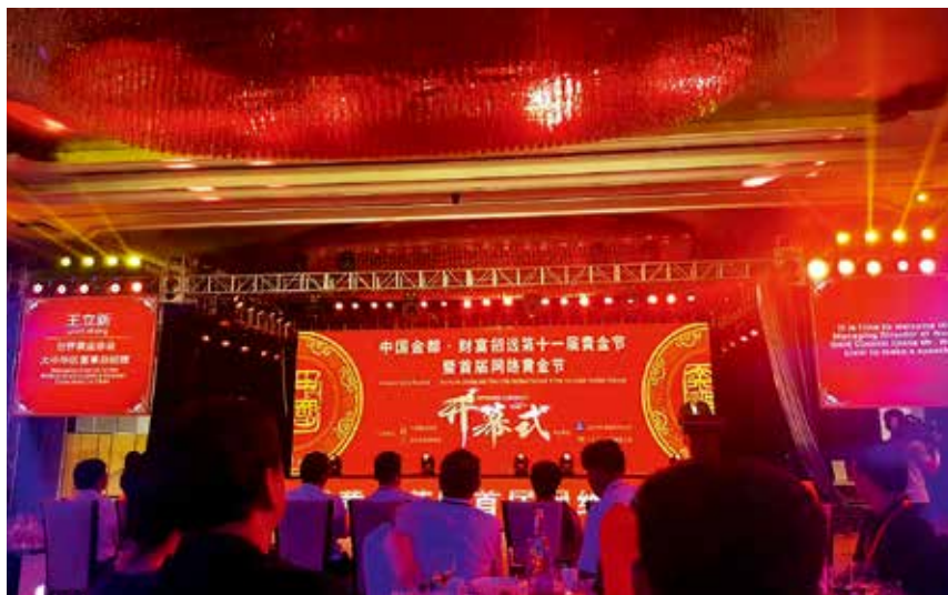
2017 年 8 月 27 日，首届网络黄金节开幕式举办

【金都招远第十一届黄金节暨首届网络黄金节】 8 月 28—30 日，第十一届黄金节暨首届网络黄金节在招远市举办。黄金节由中国黄金协会、招远市黄金协会主办，山东中矿集团、山东招金集团承办，以“中国金都·财富招远”为主题，在举办国际黄金