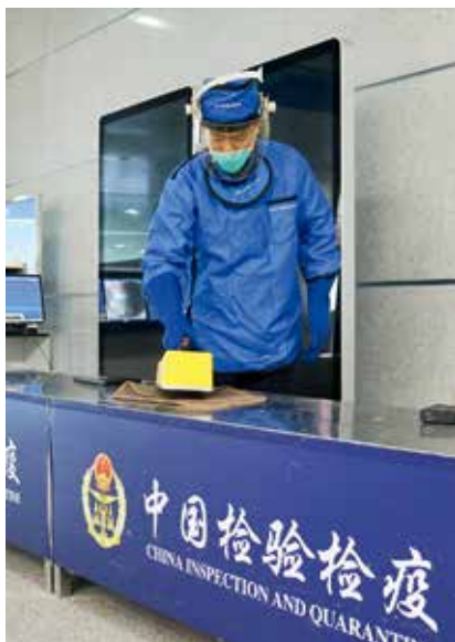
2017年7月,烟台口岸截获放射性超标255倍的保健用品

【涉企服务优化】 年内,烟台检验检疫局出台《促进烟台市新旧动能转换工作措施》《优化烟台市对外开放营商环境“27条”措施》并狠抓落实,获市委主要领导批示肯定。解决烟台港进口原油难题,当年烟台港进口原油1007.3万吨,同比增长495%。开展“增品种、提品质、创名牌”专项活动,帮促29家企业新增品种43个,新创品牌7个,马德里商标国际注册8个,指导32个出口果园取得GAP认证。帮助解决输美苹果多菌灵等难点问题,实现烟台苹果、梨出口美、加、澳等高端市场4859吨,创历史