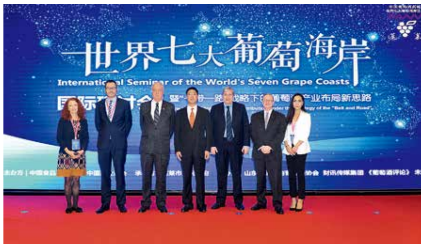
2017 年 10 月 16—17 日，世界七大葡萄海岸国际研讨会在蓬莱君顶酒庄举行

【社会生活】 全市居民人均可支配收入 29626 元，比上年增长 8.7%。其中，城镇居民人均可支配收入 42645 元，增长 7.9%；人均消费性支出 23467 元，增长 9.5%。农村居民人均可支配收入 19756 元，增长 8.1%；人均生活消费支出 13029 元，增长 7.9%。全市城镇基本养老、医疗、失业、工伤和生育保险参保人数分别达到 8.4 万人、12.18 万人、4.1 万人、5.3 万人和 5.3 万人。社会保险基金总收入 20.03 亿元，支出 19.03 亿元。参加居民基本养老保险 27.66 万人，参