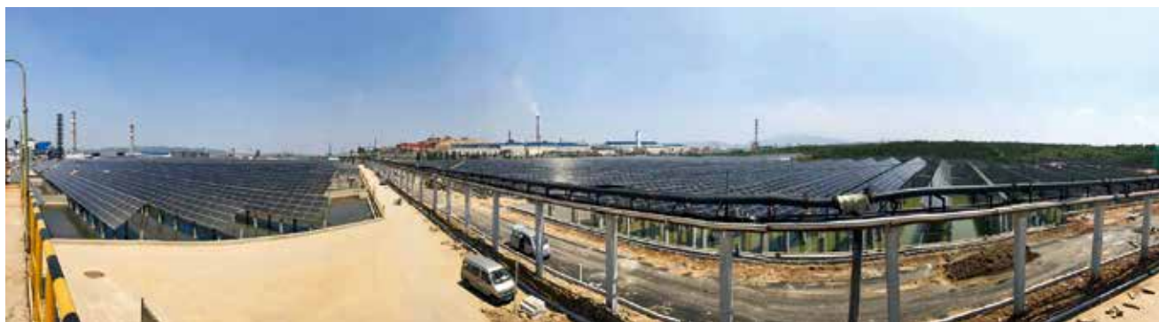
扶贫项目—恒邦光伏发电项目全景图

【发展现代服务业】 年内，牟平区休闲旅游、商贸物流、医养结合等产业加快发展，举办“养生福地·宜居牟平”城市形象（北京）推介会，“烟台人游烟台”活动在牟平举行启动仪式，北中国海公园建成开放；金湾绿