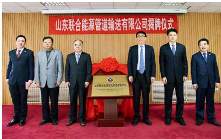
2017年12月29日,山东联合能源管道输送有限公司揭牌