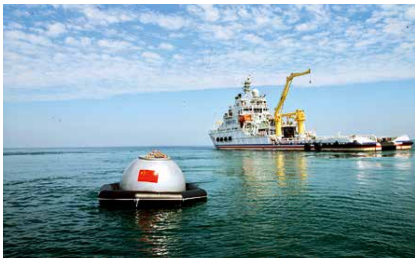
2017年8月8日，北海救助局完成中国首次组织的16名航天员和2名欧洲航天员海上救生专项训练任务保障工作

16日，“北海救119”轮在曹妃甸锚地成功救助主机故障马耳他籍空载散货船“MONEMVASIA”轮，将遇险船安全拖至山海关锚地，21名外籍船员随船获救。10月1日，“北海救116”轮在成山头正东6海里处，成功救助主机故障货船“飞雄6”轮及16名遇险人员。10月6日，“北海救111”轮在石岛东南28海里处，成功救助因碰撞进水的满载散货船“方舟568”轮及15名遇险人员。10月24日，“北海救115”轮、直升机“B7309”在大连西北50海里处，成功救助舵机故障失联渔船“辽葫渔23280”及8名遇险人员。10月29日，“北海救131”轮、直升机“B7313”在龙口一号锚地，成功救助大风中走锚的“靖四方1”轮及16名遇险人员。10月31日，“北海救118”轮在大连东南40海里处，成功救助进水渔船“辽瓦渔75277”及10名遇险人员。11