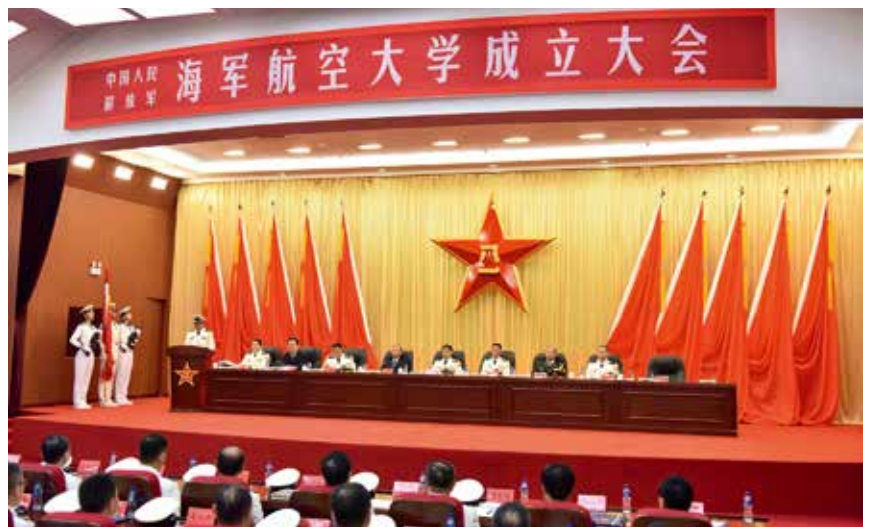
2017年7月21日，中国人民解放军海军航空大学成立大会召开

海军航空大学主要承担航空飞行与指挥、岸防导弹技术与指挥、空中战勤、航空救生、航空管制、地面领航、部队组训管理、无人机运用与指挥、航空勤务技术与指挥、舰载机起降保障与指挥、导航技术与指挥、航空反潜技术与指挥、岛礁守备分队指挥等13个专业生长军官高等教育任务，同时承担生长军官任职培训、现职军官基本培训、现职军官辅助培训、研究生教育、士官职业技术教