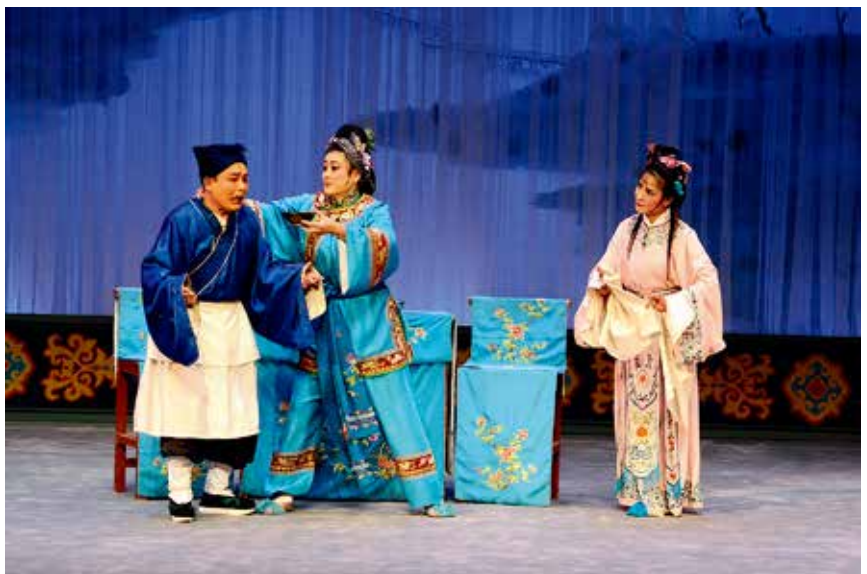
文化惠民“双演”工程优秀剧目演出

【文化产业】 年内，全市文化产业发展领导小组132项月度工作全部按期完成。制定《全市文化产业发展月度考核办法》，每月对县市进行考核，由市委办通报结果。推进重点项目建设，建立重点项目工作台账，每月调度全市52个在建、拟建文化产业重点项目，项目计划总投资400多亿元。推动朝阳、所城历史文化街区和崆峒岛改造提升工程，恒大旅游