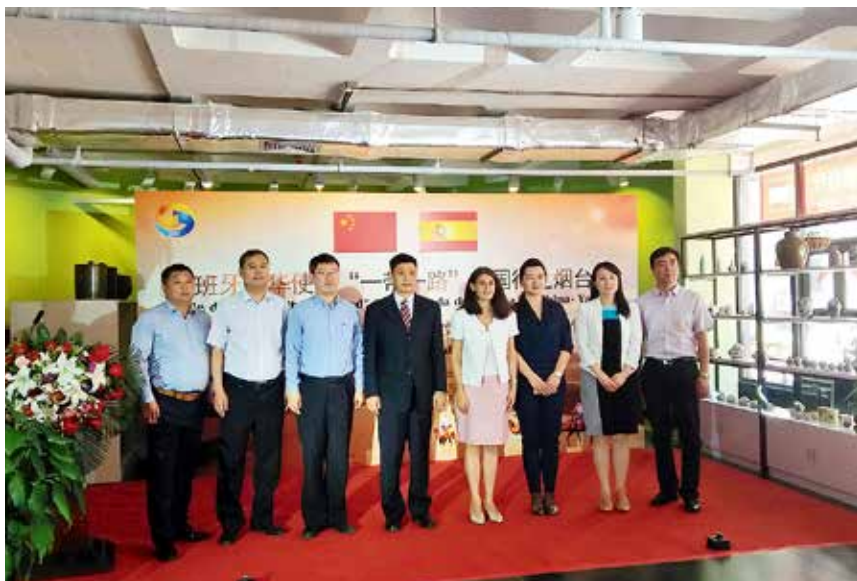
2017年5月25日，在芝罘区1861文化创意产业园西班牙文化参赞罗利亚·明格斯为全国首个西班牙文化中心揭幕

正式启动国际大学中心，并先后与韩国安养大学、东南保健大学、极东大学等高校建立授权委托业务关系。持续支持1861广告创意产业园国际馆建设，先后引进烟台亚派教育咨询有限公司、韩国赛努力教育咨询有限公司、烟台奇爷动漫有限公司等文创类公司入驻园区。年内，扩大烟台市与一带一路国家的交流，先后两次组团出访俄罗斯、白俄罗斯、格鲁吉亚、阿塞拜疆和乌克兰。推动教育领域海外合作。与韩国青少年环境体育联盟合作，邀请首尔特别市教育厅赵喜昞教育监（教育厅长）率领40多位教育界人士到烟台考察交流。促成美国Tess教育集团牵手烟台华兹华斯培训学校，双方签署留学美国海外家庭寄宿合作协议。