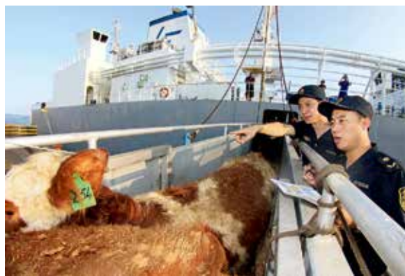
2017年8月21日，烟台口岸首次进口新西兰肉用种牛

【降低贸易成本】 全年共减免行政事业性收费5607万元、经营服务性收费700万元。4月1日起，对符合条件的出入境人员免征黄热病疫苗接种等法定体检接种费用，共计减免费用106.3万元。通过实行出入境船舶检验检疫免费申报、企业无纸化报检、监管模式创新，降低企业关联成本，减少企业交通费、仓储费、开箱费、泊港费、人员费以及贸易损失等各项成本约1.81亿元。