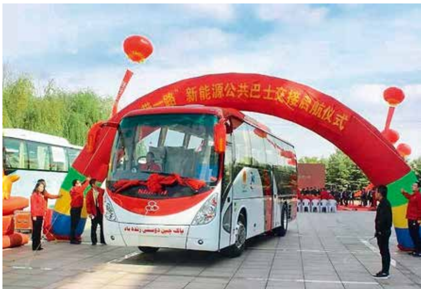
2017 年 10 月 11 日，“舒驰客车一带一路新能源巴士走向巴基斯坦”起航仪式举行