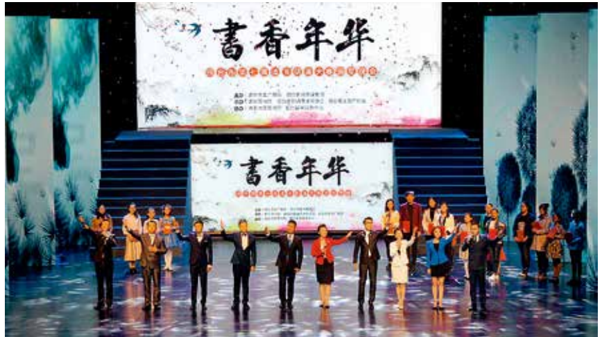
烟台市第七届读书朗诵大赛颁奖晚会

【文化市场整治】年内烟台市文化市场综合执法改革工作领导小组成立，调整市文化市场管理工作领导小组，出台《关于进一步深化文化市场综合执法改革的实施意见》。组织开展全市文化市场执法监督检查，相继开展“护航十九大·金秋行动”“平安文化