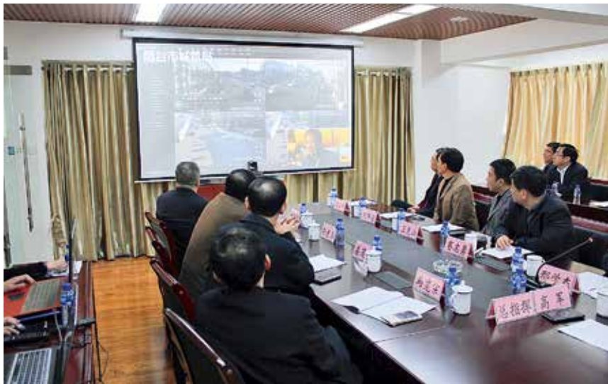
2017年12月8日，市城管局运用数字城管平台开展清雪防滑应急演练

城市供气。加强全市供气保障调度，不断扩大燃气供应覆盖面，全市新增天然气用户10万户，管道燃气普及率达到70.6%，其中市区90.5%。市区成功引进中石油泰青威管线第二气源，2017年底实现从中石油接气8.5万方/日，有效解决市区单一气源供气不足问题。深入开展燃气安全隐患排查、督查20余次，完成市区2.75万户管道液化气置换