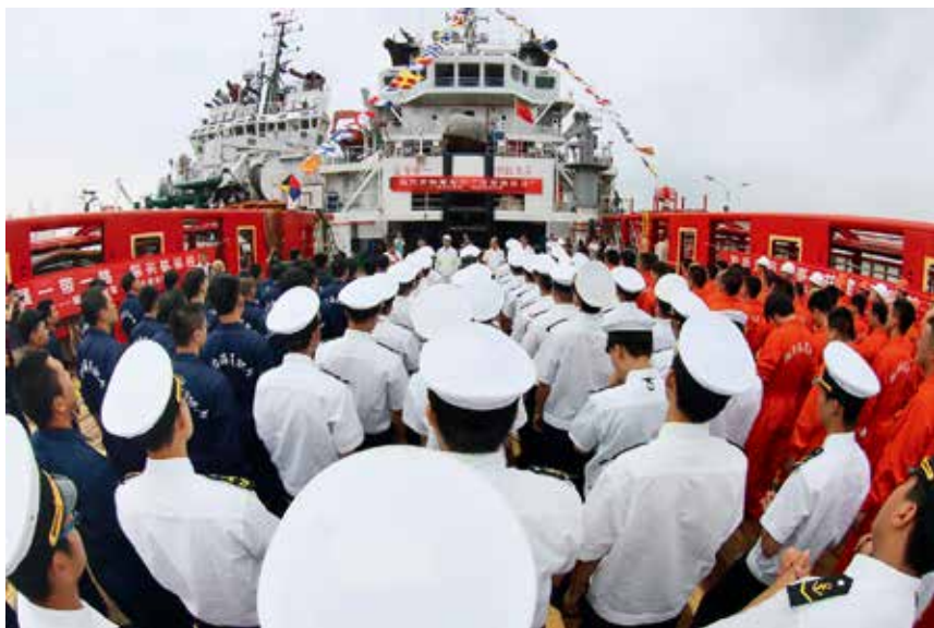
2017年6月23日，烟台海事局举行世界海员日庆祝活动