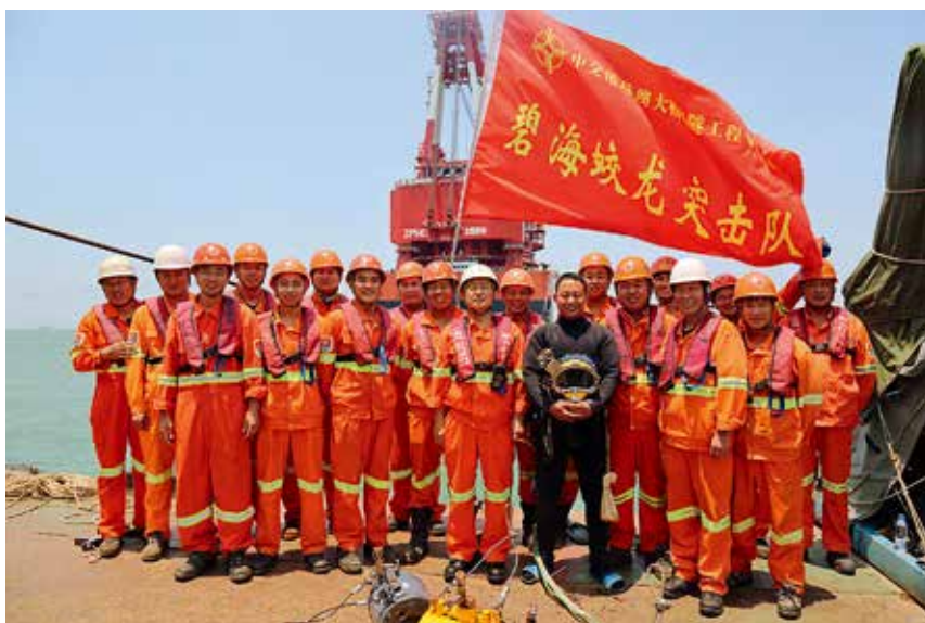
2017 年 10 月 15 日，烟台打捞局潜水工作组被港珠澳大桥岛隧工程项目部授予“碧海蛟龙突击队”称号

【港珠澳大桥岛隧工程收官打捞】 10 月 15 日，烟台打捞局圆满完成港珠澳大桥岛隧工程建设。2012 年 10 月烟台打捞局潜水项目部正式进驻岛隧工程建设现场，高质量完成 33 节 80 米长沉管的水下对接任务，单节对接误差均控制在 3 毫米以内，最精确达 0.8 毫米，累计完成 27 万平方米的海底探摸，清理钢端壳面积 3.3 万平方米，投放回淤盒 1678 个，潜水作业时间累计超过 1.5 万小时，实现中国