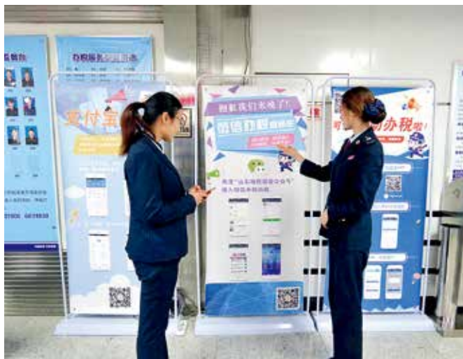
2017年12月1日，市地税局微信办税正式上线

次，发放贷款855万元。做好“走出去”企业服务与管理工作，走访“走出去”企业98户，与国税部门联合开展“税收助力‘一带一路’发展主题宣讲系列活动”，全市共80户“走出