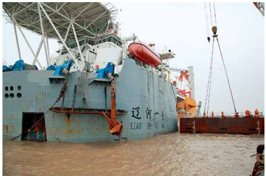
2017年4月2日，“辽河一号”沉船打捞现场

务。此次救捞工程创造并刷新多项烟台救捞历史记录：“辽河一号”轮坐沉于潮间带，低潮时水深仅0.5米，而难船自重近15000吨，此次救助创造了烟台打捞局极浅海船舶救助最大吨位的新纪录；此次救捞工程首次设计、建造、使用了特种浮箱抬浮难船，创新了救助工艺和设备，为此后同类海域救捞工程提供借鉴；此次救