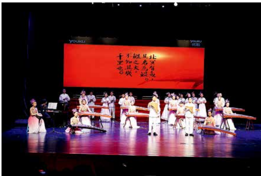
2017年6月1日,烟台市社会主义核心价值观组歌传唱暨第五届中小学舞蹈、器乐大赛牟平区专场比赛在文化中心大剧院举行

7月31日,龙泉镇美丽乡村标准化试点项目、区政务服务中心政务服务标准化试点项目获得 2017 年度