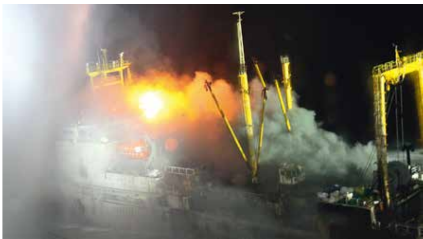
2017 年 8 月 9—17 日，“北海救 101”轮、“北海救 112”轮在威海龙眼港成功救助失火的俄罗斯籍大型远洋渔船“VICTORIYA”轮

往龙口市丁家镇奚韩村南山，成功扑灭两处山火。5 月 3 日，“北海救 118”轮在石岛南 80 海里处成功救助主机故障散货船“宏伟 618”轮及 18 名遇险人员。7 月 21 日，“北海救 115”轮、“北海救 117”轮、救助直升机“B7309”在滦河口附近成功救助沉没工程船“mingxing18”轮 5 名遇险人员。7 月 21 日，救助直升机“B-7125”在滨州附近海域成功救助搁浅运砂船“祥顺 777”轮及 6 名遇险人员。7 月 31 日，“北海救 116”轮在石岛南 70 海里处救助主机故障油船“大庆 739”轮及 16