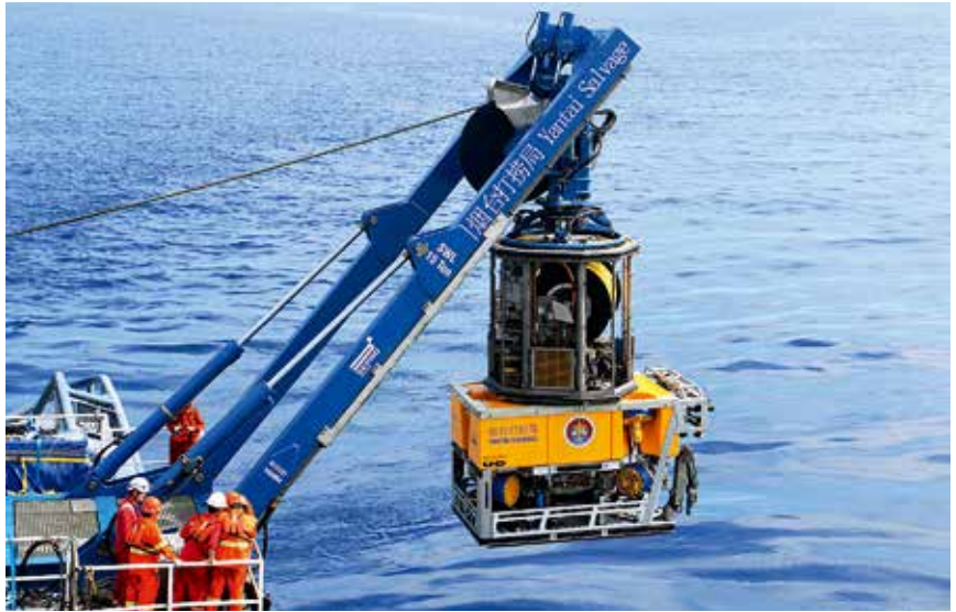
2017年4月9日，烟台打捞局完成3000米级ROV海试任务

捞局3000米级重型ROV（水下作业车）为期5天的海试任务结束。此次海试，ROV最大下潜深度2951米，标志着中国救捞系统具备3000米级深水救捞能力。