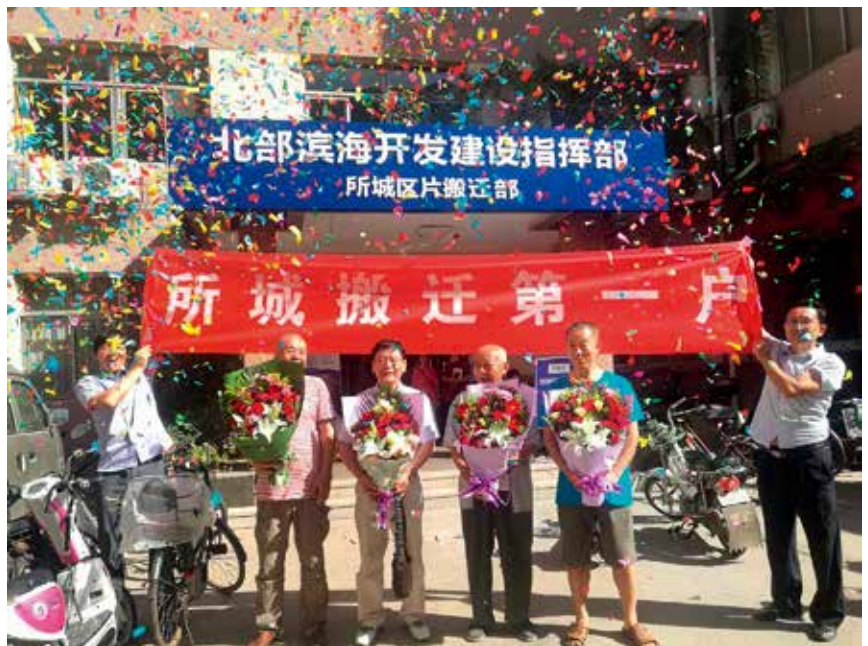
所城里搬迁第一户

校 5 所，职业高中学校 1 所，附设中职工班 2 所，共有在校生 1 万人。十二年一贯制学校 2 所；高级中学 1 所；完全中学 6 所；九年一贯制学校 7 所；初级中学 12 所；小学 40 所；特殊教育学校 2 所。普通高中在校生 1.5 万人；初中在校生 2.6 万人；小学在校生 4.1 万人；特殊教育在校生 0.03 万人。取得省科技奖励 1 项。专利申请 2346 件，授权专利 1275 件。群众艺术馆、文化馆 1 处，公共图书馆 2 处，档案馆 1 处。广播、电视人口覆盖率均达到 100%。全区拥有各类医疗卫生单位 644 家，其中部队医院 1 家，市直医院 7 家，区直医院 9 家（其中挂社区卫生服务中心牌子 6 家），企事业单位及社会力量兴办的医院 42 家，社区卫生服务机构 72 家，门诊部、诊所和卫生所 512 家，疾病预防控制机构 1 所。辖区内医疗机构床