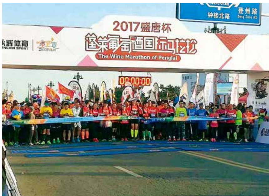
2017年11月12日,2017盛唐杯·蓬莱葡萄酒国际马拉松在蓬莱海滨举行