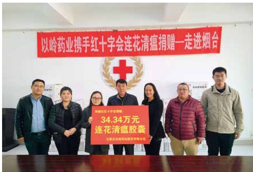
市红十字会联合爱心企业举办送爱心送健康活动

【志愿者队伍建设】 年初，市红十字会制定优秀志愿者表彰奖励办法，年内评选表彰65名优秀志愿者。6月底，烟台护士学校的优秀志愿者代表烟台市幸福社区急救志愿队参加全省应急救护大赛获得二等奖和优秀组织奖。7月，牟平区“衣往情深西部行”公益捐赠项目，被市委宣传部等10个单位联合授予烟台市学雷锋志愿服务“四个50”最佳志愿服务项目，12月被省委宣传部授予山东省学雷锋志愿服务“四个100”最佳志愿服务项目。