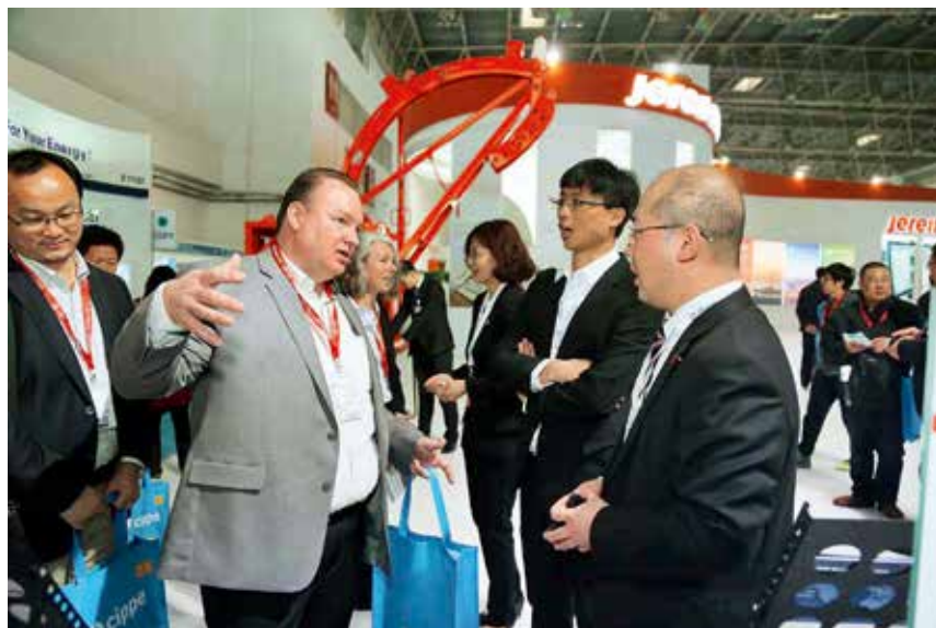
杰瑞集团亮相全球最大石油展

【社会生活】 城镇居民人均可支配收入 48711 元，增长 8.2%；人均消费性支出 31090 元，增长 7.9%；人均住房建筑面积 33 平方米。农村居民人均纯收入 20625 元，增长 7.9%；人均生活消费支出 13260 元，增长 10.8%；人均住房面积 33.3 平方米。全区城镇基本养老、医疗、失业、工伤和生育保险参保人数分别达到 6.18 万人、7.94 万人、5.83 万人、5.91 万人和 5.91 万人。城乡居民养老保险参保 11.37 万人。全区城乡最低生活保障救助 1484 人。其中，城镇低