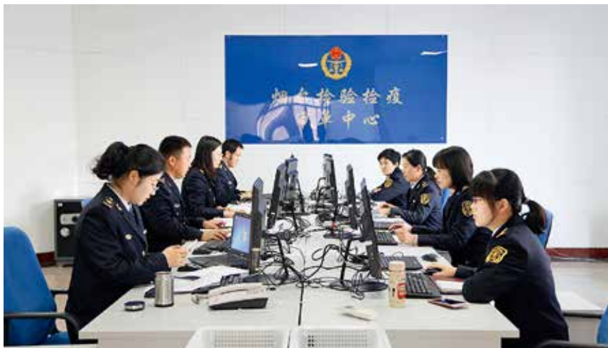
2017年11月16日,山东检验检疫系统内首家审单放行中心在烟台启用

【水上安全监管】 年内,烟台海事局提请市政府召开全市冬季海上安全暨搜救工作会议,制定西港区30万吨级主航道附近水域安全风险管控责任清单,与海洋渔业、港航部门签订《海上联合联动执法合作框架协议》,与驻烟部队签订《军地联合海上安全监管协作机制》,开展海上巡航1270次、2.97万海里,查处非法砂石运输船舶15艘,非法载客船舶12艘,驱离碍航渔船1300余艘,清理碍航养殖145公顷。强化船舶监督管理,现场检查船舶10402艘次,查纠缺陷3468项;实施船舶安检1024艘次,查出缺陷7174项,滞留船舶83艘。加强航运公司日常监督检查,检查公司144次、查纠隐患318项。实施行政处罚360件、罚款270万元,分别同比增长61.5%和39.6%。牵牢客运安全“牛鼻子”,推行客运船舶动态监控清单,编制《客船船员监管指南》,协调更新客运船舶87艘,推动蓬长航线实施儿童“零元票”制度,解决了旅客人数统计不准确问题。严格落实禁限航措施,辽鲁省际客运航线停航252小时,蓬长陆岛运输航线停航470小时,客运船舶连续12年未发生等级以上事故。