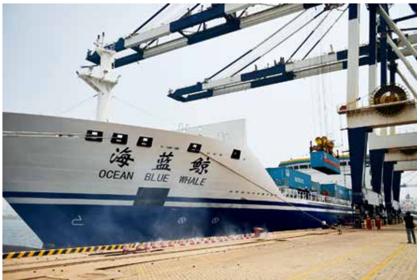
2017 年 6 月 29 日, 烟台渤海国际轮渡公司旗下世界最大客箱船“海蓝鲸”号首航烟台至韩国平泽航线

【文明创建】 全市交通运输行业连续 10 年保持全国文明行业荣誉称号, 全市交通运输系统 2 个单位保持全国文明单位称号; 烟台市交通运输管理处、蓬莱市交通运输局、烟台市牟平公路管理局等 3 个单位成功创建为省级文明单位, 总量达到 36 个; 国家级青年文明号集体 2 个, 省级青年文