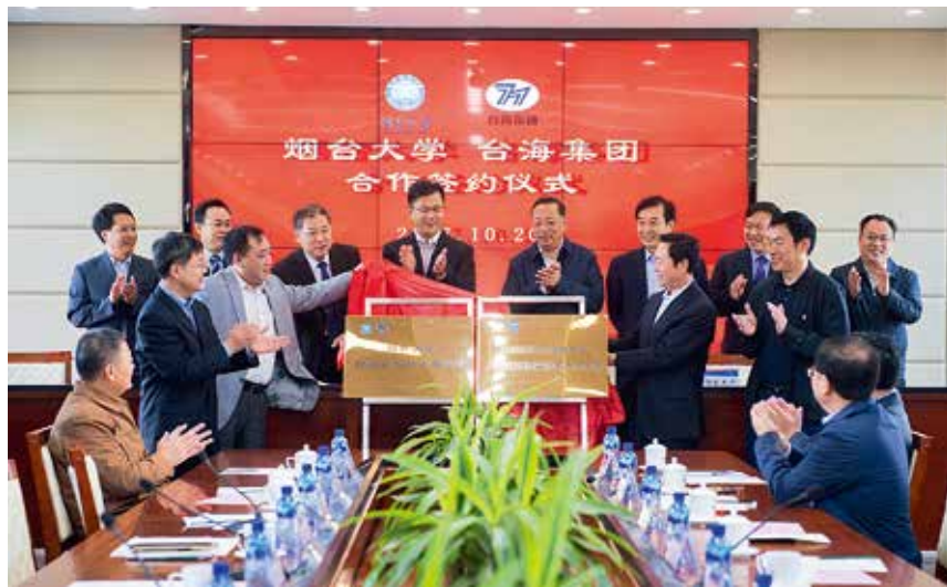
2017年10月20日,烟台大学与烟台市台海集团有限公司合作签约仪式在烟台大学举行

中心。有4个国家级特色专业,3门国家级精品课和双语教学示范课程建设项目,1门国家级精品资源共享课,1个国家级教学团队。有2个国家技术转移中心,1个教育部重点实验室,1个国家民委民族理论政策研究基地,1个国家知识产权培训基地。7个省级重点学科,1个省高等学校协同创新中心,7个省级重点实验室,1个省人大常委会地方立法研究服务基地,1个省理论建设工程重点研究基地,2个省高校人文社科研究基地,1个省民族问题研究中心,7个省级工程技术研究中心,1个省泰山学者种业人才团队支撑计划,1个省高校优秀科研创新团队,1个省国际(港澳台)科技合作平台,1个省级研究院,1个省软科学研究基地,1个省级大学科技园。与26个国家和地区的115所院校和学术机构建立友好合作关系。是全国首批获准接收外国留学生及可以邀请外国文教专家的院校之一。