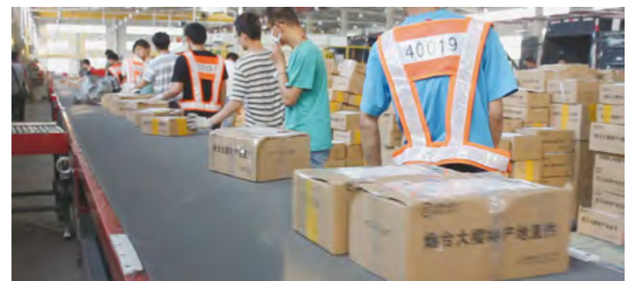
快递运送流水线上的烟台大樱桃

【行风建设】 市邮政管理局参加烟台广播电台“民生热线”直播栏目和胶东在线网站“网上民声”互动栏目,与市民零距离沟通交流。在《烟台日报》刊登全市有经营资质的快递企业名录,并发布寄递快递注意事项提示。在“3·15”国际消费者权益日,组织开展面向普通群众的户外现场意见征集和公益咨询活动。充实邮政社会监督员队伍,实现县(市、区)全覆盖。引导6个快递企业基层单位创建市级“青年文明号”,行业内市级“青年文明号”达到7个,并有1个被推荐创建省级“青年文明号”。