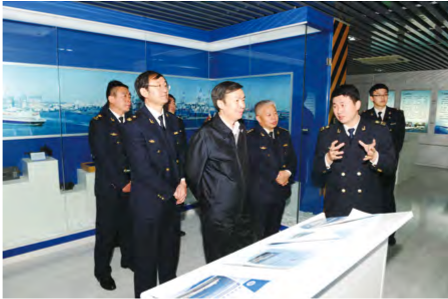
2014年4月29日，交通运输部何建中副部长视察烟台海事局。

【服务地方经济发展】 年内，烟台检验检疫局制定实施“促进烟台外贸稳定增长22条措施”，工作成效得到省、市领导高度评价。简化备案审批程序，单个企业取得备案证书的周期由以往的20个工作日缩短到最多5个工作日，累计为企业节省备案审批时间1500个工作日。以保税港区办事处成立为契机，完善进境货物集中查验和“一站式”服务工作机制，进境货物平均查验时间由2个工作日下降到2个小时。在实行入境船舶“预抵检疫申报制度”的基础上，创新分类管理工作模式，缩短入境船舶检疫通关周期。自主研发电子收费系统，实现与企业银行账号自动关联划款。执行国家各项收费减免政策，累计减免收费2489多万元。指导企业用好原产地优惠政策，共签发各类原产地证书2.3万份、签证金额14.6亿美元，为企业赢得进口关税减免7300多万美元。新增出口食品备案企业11家、累计330家，推荐对外注册企业14家、累计252家。指导3家水产企业通过韩国官方检查，4家食品企业通过美国FDA检查、帮助烟台砂梨通过美国官方考察和澳大利亚官方预检。争取山东出入境检验检疫局支持，对海阳核电、万华工业园、现代汽车研发中心、东岳汽车等重大项目进口设备给予“属地报检、口岸放行”“共同检验”等优惠政策，累计为企业节省检验费600多万元。特别是争取对万华工业园进口散装化工原料实施“共同检验”政策，年可为企业节省检验费380万元。指导烟台港通过国家质检总局验收，成为中国首批进口粮指定口岸、山东省唯一可同时承接散装和集装箱业务口岸。指导鸿富泰公司及时解决出口机器人内锂电池危险品检验技术难题，支持该公司生产的机器人出口日本。