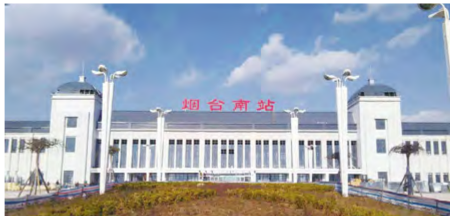
青荣线烟台南站外景