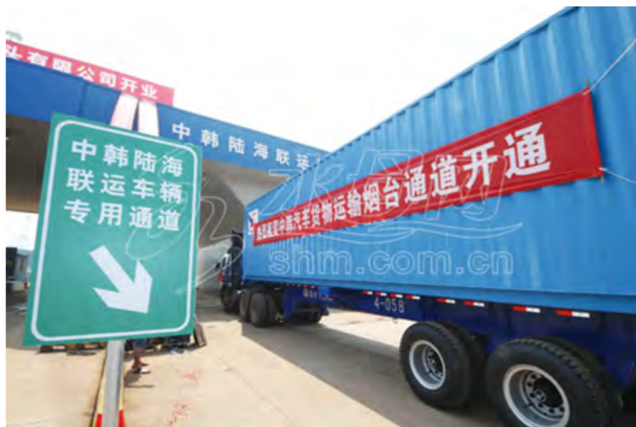
2014年7月1日,烟台首条对韩国的客滚航线——烟台至韩国平泽客货班轮航线开通运营。

【公交客运管理】 年内,调整优化市区公交线路18条,新开通芝罘区、开发区、莱山区至莱山机场巴士线路3条。市区公交线路达到100条,其中跨区线路52条,公交线路长度2638公里,基本形成以跨区线路为骨干、区内线路为基础、支线和专线为补充的六区一体化公交网络。开通延伸城乡公交线路14条,完成7条省级城乡一体化示范线路创建工作初审,福山区被确定为全省城乡公交一体化示范县。全市首条城际公交线路(栖霞经济开发区至烟台经济技术开发区)开通运营。围绕青荣城铁和烟台蓬莱国际机场集疏运,论证规划公交快线18条,开通通达城铁烟台南站公交快线3条。服务大型会展,增发区间车、公交专线车6000多辆次。