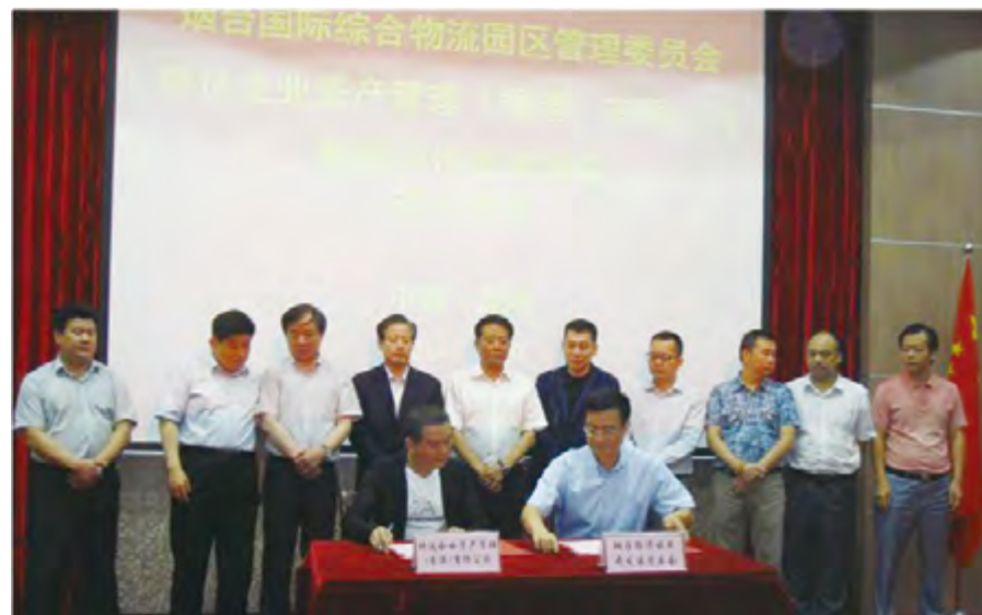
2014年10月20日，骅达100万吨级冷链批发市场项目举行签约仪式。

【城市建设】 至2014年底，全区城市基础设施累计投入35亿元，主次干道从原有6条增加到24条，通车里程从29公里增加到80公里，“六纵六横”路网整体拉开；铺设各类市政管线309公里，燃气、热力、自来水管网覆盖率分别达到80%、85%、90%；新增绿化面积310万平方米，城区绿化覆盖率超过41%；完成马山河、通海东河、通海西河等河流治理15公里，总投资22.6亿元的辛安河综合开发列为山东省重点文化产业项目；科技CBD组团创业大厦、科技广场、烟台蓝海国际软件