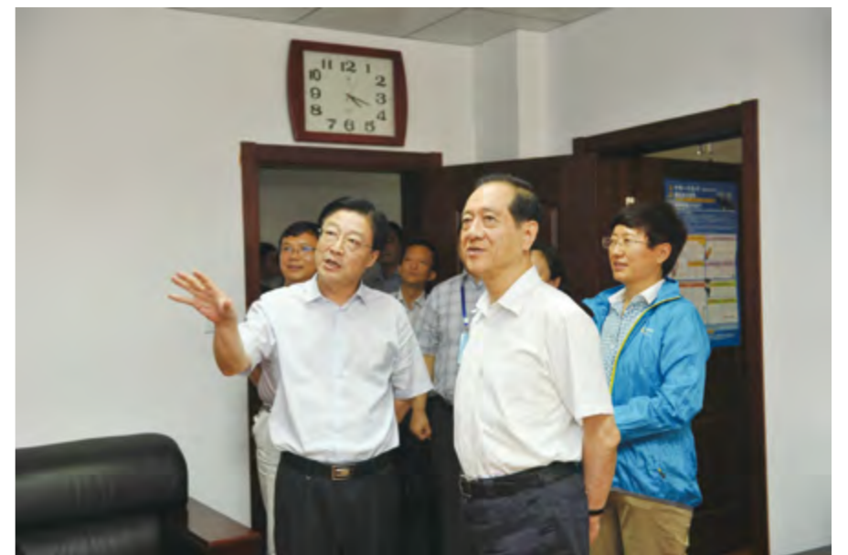
2014年8月13日，全国政协副主席、九三学社中央主席韩启德主席在山东省副省长、九三学社山东省委主委王随莲陪同下视察社市委机关。

【参政议政】 年内，九三学社市委在中共烟台市委恳谈会上提出“加强渔民专业合作社发展”等2条建议。社市委和担任政协委员的社员共提交各