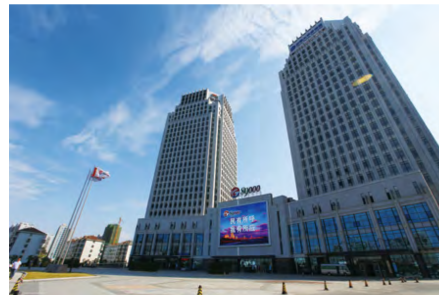
莱山区89000民生服务中心

【教科文卫体】 2014年莱山区有普通高中1所，在校生0.2万人；初中4所，在校生0.36万人；小学15所，在校生0.82万人。共取得市（地）级及以上各类重要科技成果38项，其中省科技奖励1项。专利申请373件，授权专利104件。有档案馆1个，公共图书馆1所，文化馆1个。广播、电视人口覆盖率均为100%。有卫生机构319个、床位2246张，卫生技术人员2648人。