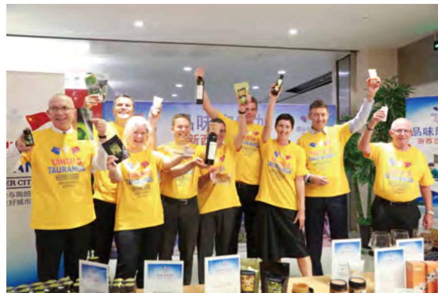
2014年4月1日,新西兰陶朗加市友好代表团一行在振华超市举办“品味陶朗加—新西兰商品展”。

【外事管理】 年内,市委调整外事工作领导小组,对外事接待和活动、对外友好交流、邀请外国人来烟、境外领事保护和涉外事件处置、外国记者及境外非政府组织管理等进行重新规范。按照“因事定人、人事相符”的原则,严格执行因公出访计划报批和量化管理制度。审批因公出国团组300批567人次,同比分别下降40%和55%,调整压缩不合理团组21批8人124人天,未批准团组14批49人次,办理因公护照253批525人次,颁发港澳通行证21批36人次,代办赴各国因公签证354批782人次,申办APEC商务旅行卡51批108人次。完善领事保护联动机制,注重预防性领保工作,处理领事保护案件8起、涉外案件12起。办理外国人来华邀请确认函1254批,1711人次,推动烟台各领域涉外人才的引进。组织亚洲主流媒体采访团、海外华文媒体在烟采风拍摄活动。配合中国华文教育基金会和省侨办“海外华文老师工程”,开展“海外红烛故乡