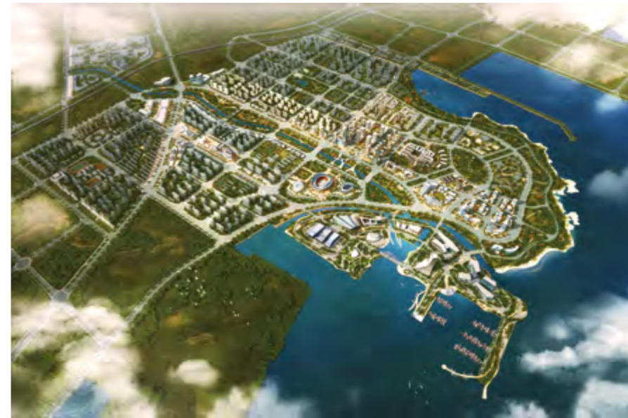
八角中心区总体规划鸟瞰图

消费性支出26989元,增长6.1%。城镇在岗职工年平均工资预计56241元,增长5.5%。全区城镇基本养老、医疗、失业、工伤和生育保险实际缴费人数分别达到18.1万人、18.1万人、15.3万人、15.3万人和14.9万人。城乡居民养老保险参保1.5万人,全区城乡最低生活保障救助2070人,其中城镇低保1612人,农村低保458人,农村五保供养44人。收养性社会福利单位6个,收养607人。社会福利企业12个,安置残疾人员70人。