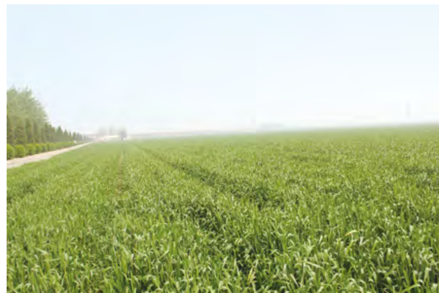
马连沟小麦丰产方