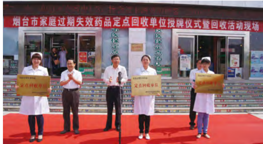
2014年5月17日，烟台市举行家庭过期失效药品回收单位授牌仪式。