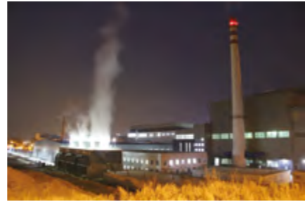
垃圾湿解二期工程夜景

热中心投入使用。 【基础设施改造】 年内，门楼水库泵站、珠玑加压站重建、宫家岛水厂除铁锰配套项目完工，11项供水管网更新改造工程实施。完成垃圾处理场渗沥液膜处理、垃圾渗沥液排污管线、调节池扩建等工程，争取专项资金2000多万元，对转运站和垃圾处理场设施设备进行维修改造。外夹河污水配套管网、辛安河污水厂污泥料仓、港站立交桥排水改造工程完工，完成19项排水、污水工程交接，定期对全市污水、垃圾处理项目建设管理情况进行调度和信息上报。完成老城