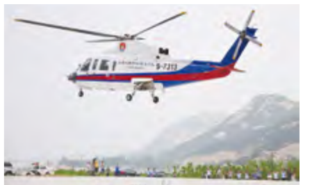
2014年5月，昆崙山保护区森林防火直升机起降点建成并投入使用。

【森林防火直升机起降点建成并试飞成功】 5月建成并投入使用。7月17日，海军北海舰队航空兵司令部航管处、民航青岛监管站、山东航空产业协会联合进行现场考察、协调、验收工作，交通运输部北海救助飞行大队S-76型直升机试飞成功。