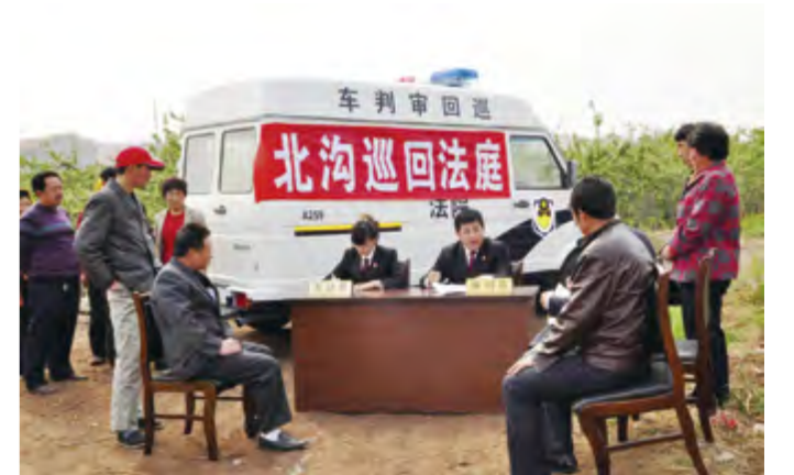
巡回法庭开展巡回审判。