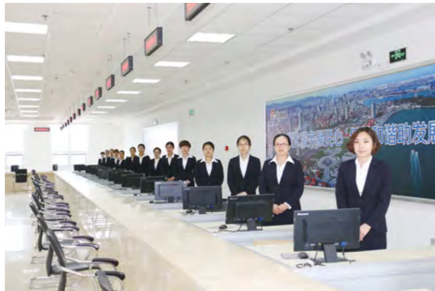
芝罘区89000民生服务中心三楼服务大厅

长6.4%；人均住房建筑面积31.6平方米。城镇在岗职工年平均工资58102元，增长13.6%。全区城镇基本养老、医疗、失业、工伤和生育保险参保人数分别达到15.9万人、35.6万人、9万人、9万人和7.6万人，比上年分别增加0.9万人、2.6万人、0.8万人、1.1万人和0.5万人。社会保险基金总收入17.36亿元，比上年增加0.92亿元；支出18.6亿元，增加3.74亿元。城乡居民社会养老保险参保人数2.2万人，新型农村合作医疗参合人数2万人。全区城镇最低生活保障救助13419人。收养性社会福利单位27个，收养2479人。社会福利企业8个，安置残疾人员148人。