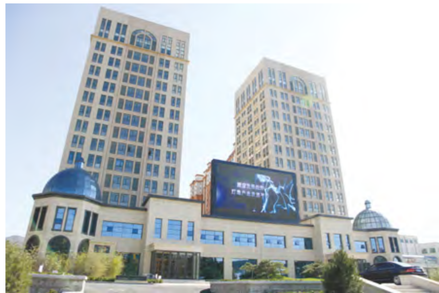
烟台人力资源服务产业园外景

烟台1861广告创意产业园27万平方米新载体主体完工，入园企业达到350家，实现经营额2.1亿元，被评为“省级文化创意产业‘金种子’试点孵化器”。烟台电子商务产业园一期5.4万平方米电子商务创新港正式运营，入驻淘宝网特色中国烟台馆、搜家网、阳光乔等39家电商企业，设立淘宝大学、阿里学院等电商培训机