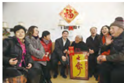
2014年1月28日，中国民协书记罗杨、市委宣传部长刘延林看望慰问烟台市芝罘区社会福利院老人。

作品11幅，拍卖资金用于资助农村困难家庭孩子。1月15日，刘泽文等17位书画家走进社区开展“新春文化进社区”服务活动；5月23日，刘泽文等13位书画家赴中国人民解放军总装备部驻烟招待所开展“拥军、颂军、乐军”文艺志愿者送书画到部队笔会活动。1月27~28日，中国民间文艺家协会分党组书记、驻会副主席罗杨带领多位民间文艺家来烟开展“送欢乐、下基层”活动，分别到烟台国际SOS儿童村、芝罘区社会福利院进行文艺慰问。市舞蹈家协会7月29日在烟台开发区举办“全民健身月月红——体育舞蹈进社区夏日文化广场大型文艺汇演”活动。市曲艺家协会8月22日在福山区河滨广场举行“笑在福山——专场曲艺晚会”；11月28日在福山区清洋街道西黄埔居委会举行“笑在福山乐在清洋”曲艺感恩专场晚会。