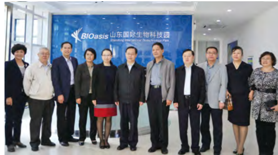
2014年10月11日，致公党中央常务副主席蒋作君（中）一行到山东国际生物科技园调研。

【服务社会】 5月，致公党市委继续开展“同心烟台·服务社会实践月”活动，全市各级致公党组织开展各类社会服务活动10次，捐款捐物累计折合人民币16.2万元，受益群众学生约200人，参与的基层组织8个，党员超100人次。芝罘区一支部在奇山社区开展法律咨询服务；莱阳支部为特殊教育学校师生捐赠2.2万元的款物；龙口支部为帮扶村一馆前于家村基础设施建设提供资金4万元，并签定法律援助协议；福山支部为大樱桃种植户举办科技讲座；鲁东大学支部发起设立“海忠奖助学金”，每年资助3万元；莱山区支部为五个村居的文化大院捐赠价值7.1万元的图书和影视设备。市委会筹集价值3万元的物资，专程赶往致公党省委定向帮包村开展学习实践活动，为百步岭小学的师生奉献爱心。年内，市委会坚持送文化进社区；莱阳支部捐款为万第初中义务植树、为莱阳复健医院脑瘫儿童和部队官兵送去图书；福山区支部开展温暖送学子活动，为学校捐赠3万元的太阳能热水器；鲁东大学支部走进企业，开展校企合作；莱山区支部持续开展资助“春蕾女童”和“困难母亲”活动；牟平区支部开展向藏区捐款捐物活动。全年，市委会及党员先后提供文化、科技、医疗咨询服务20余次，资助困难学生710人，支持帮扶3个村开展新农村建设，累计捐款捐物226万