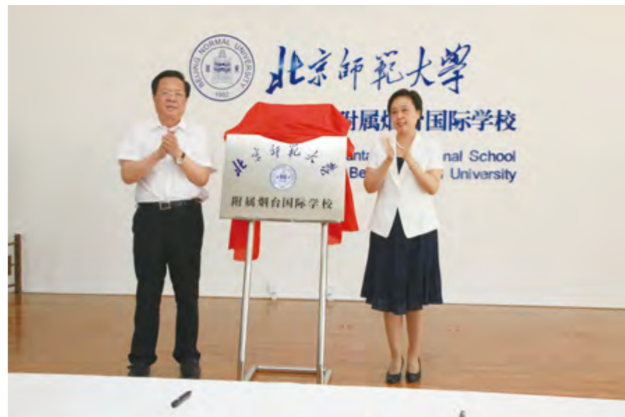
2014年5月28日，北京师范大学附属烟台国际学校举行揭牌仪式。

线、中国日报、齐鲁网、民主与法制社、齐鲁电视台、水母网等10家中央、省、市级媒体集中入驻。