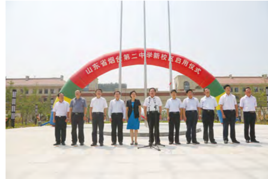
2014年8月19日，烟台二中高新区校区举行启用仪式。

服务平台。超市共分五层，建筑面积约1.5万平方米。合作银行、券商、创投等金融服务机构达到52家，超市融资项目库企业达116家。