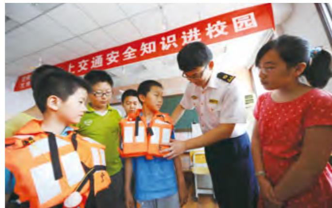
2014年6月18日,烟台海事局启动“水上交通安全知识进校园”活动。

局被确定为“山东省青少年文化交流中心海上安全教育基地”。受理海事政务127669件次,主动公开海事信息17141份,多渠道答复咨询建议400余条,接听海事热线1万余次;“烟台海事微政务”入选新浪政务微博“精英扶植计划”名单。