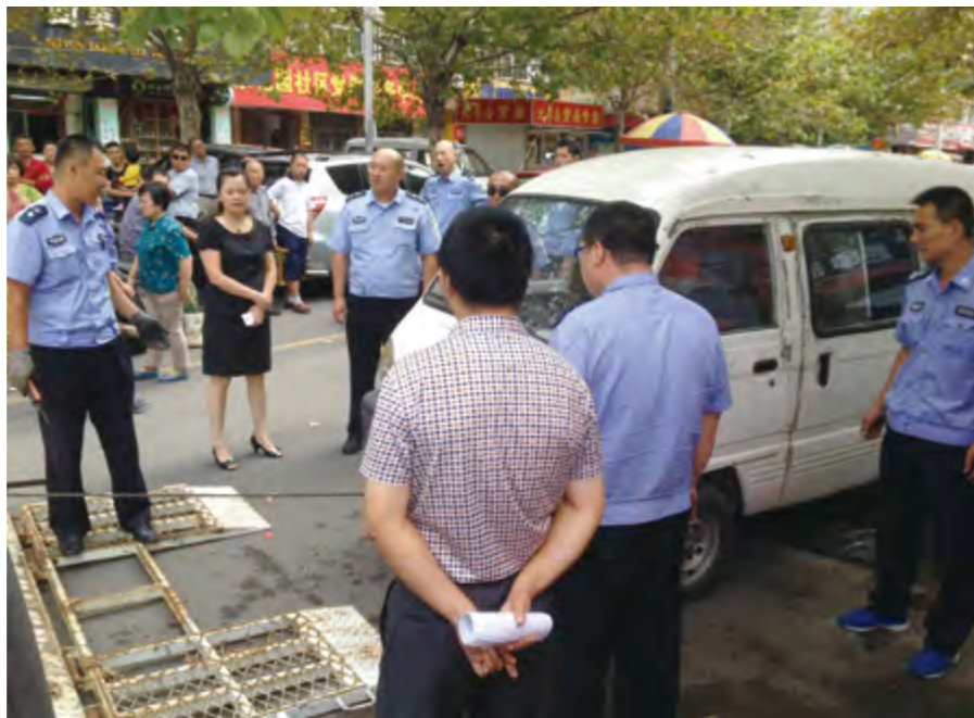
2014年9月15日，区城管局联合交警部门整治僵尸车。

【旧城旧居改造】 年内，区内旧城改造，金融中心B区非住宅、三站新区鸿泰市场地块非住宅、喜乐酒店南地块住宅征收顺利完成，白石旧城改造一期25万平方米安置房主体封顶，龙海家园C区顺利开工，慎礼商住区项目确定投资主体。腾空朱家疃、南尧等4个居民区旧址，完成东南哨、沙埠等11宗土地出让，有序推进32个旧居改造安置房建设，全年旧居改造复工面积达到122万平方米。化工南路、竹林路全线通车，新桥西路还建、通林