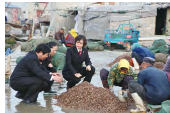
法官走进渔民家中,开展诉讼调解、法律咨询等工作。

【公正司法】年内,全市法院推进严格司法,严把案件事实关、证据关、法律关和程序关,一、二审后服判息诉率99.5%。加强人权司法保障,严格贯彻罪刑法定、疑罪从无等原则,对5起公诉案件裁定准予检察机关撤回起诉。规范审判权运行,健全审判权内部监督制约机制,建立内部人员过问案件记录制度和责任追究制度,严禁违反规定干预他人办案。推行随机组成合议庭,保证合议庭成员平等行使审判权。完善审委会工作机制,强化管理、监督、指导功能,