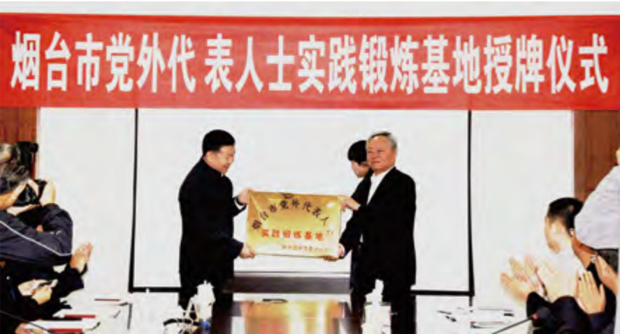
2014年10月15日，首个市级党外代表人士实践锻炼基地授牌仪式在招远开发区举行。

高校培养创新型人才提供资金支持。“八一”期间，组织部分会员企业先后赴预备役76师、海军某雷达站进行慰问，捐款捐物20余万元。