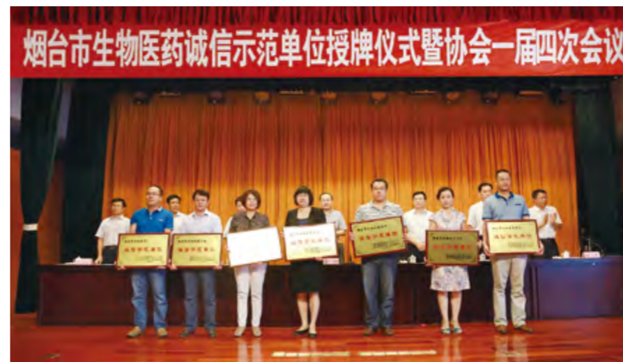
2014年8月28日，烟台市举行生物医药诚信示范单位授牌仪式。

【保健食品化妆品安全监管】 年内，市食药监局制定出台《关于保健食品经营申办有关事项的通知》，规定全市从事保健食品的经营者应当依