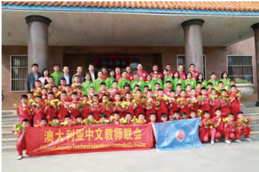
2014年4月20日,烟台市举办“2014中国华文教育基金会大洋洲资深华文教师齐鲁文化行”。

行——2014中国华文教育基金会大洋洲资深华文教师齐鲁文化行”活动。派遣2批华文教师赴所罗门和泰国任教,为讲好中国故事、传播烟台声音拓展新的渠道。妥善处置英国BBC等多批外国记者采访“招远全能神邪教成员杀人”恶性案件,稳妥做好该案开庭期间的境外舆论引导。