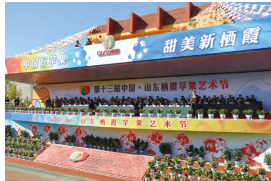
2014年9月30日至10月31日，栖霞市举办第十三届山东栖霞苹果艺术节。

【 城乡公交运营体制改革 】 2013年，栖霞市开启城市公交运营体制改革。2014年8月，由烟台交运集团栖霞公交公司与烟台经济开发区公交公司共同出资、合作投入10部新能源车辆，开通烟台市首条城际公交线路—栖霞经济开发区至烟台经济技术开发区城际公交线路。至年底，开通覆盖栖霞主干道及镇街驻地、重点企业、集市、学校等区域的公交线路，公交线路由6条增加到30条，营运车辆由31部增加到67部，均为新型环保LNG车型，采取“六统一”（车型、标识、排班、票价、服务标准、经营）的