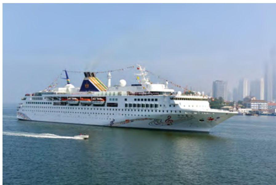
2014年8月16日，国内首艘自主经营邮轮“中华泰山”号投入运营，从烟台港首航，驶往韩国仁川港。

【概况】 2014年，全市公路通车总里程1.82万公里，其中，国省道2353公里，公路密度132.3公里/百平方公里。港口生产性泊位186个，其中万吨级以上泊位80个；港口货物吞吐量3.2亿吨，同比增长11.5%；完成集装箱吞吐量235.6万标箱，增长9.6%。公路、水路完成客运量7330万人，增长5.6%；货物运输量1.95亿吨，下降0.8%。烟台至韩国平泽客滚航线正式开通。国内首艘自主经营邮轮“中华泰山”号投入运营。烟台港精装化肥出口量增长72%，成为世界化肥出口第一港。烟台至台湾集装箱航线获两岸交通部门批准。