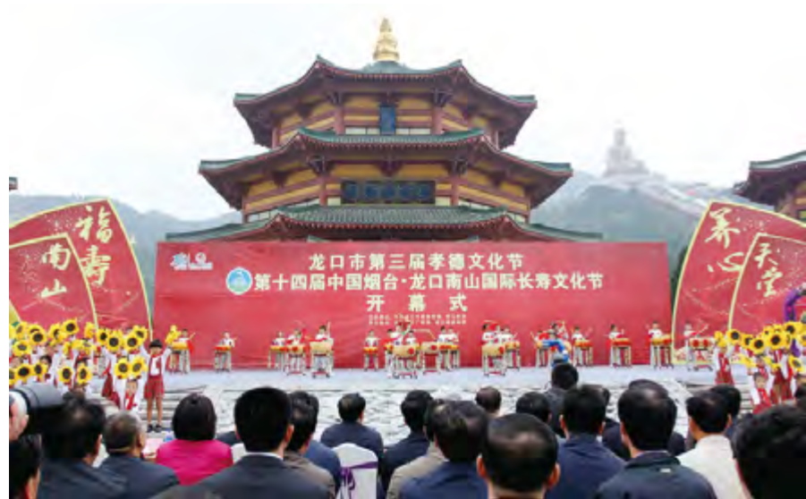
2014年10月1日,龙口市第三届孝德文化节·第十四届南山国际开幕。

【教科文卫体】 年内有普通高等院校1所,在校生1.9万人。中等职业、技工学校4所,在校生11460万人。普通高中2所,在校生9137人;初中24所,在校生29964人;小学27所,在校生28859人。特殊教育学校1所,在校生79人。获得省科技奖励4项。发明专利申请287项,发明专利授权57项。有艺术表演团体53个,群众艺术馆、文化馆2处,公共图书馆16处,档案馆1处。广播电视人口覆盖率均达到100%。有卫生机构430所,其中医院20所、卫生院13所,疾病预防控制机构1所,妇幼保健机构1所。各类卫生机构共有床位3846张,卫生技术人员4873人,其中执业医师及执业助理医师2331人,注册护士1209人。有体育馆5座,全年参加省级以上体育比赛共获奖牌21枚,其中金牌10枚。