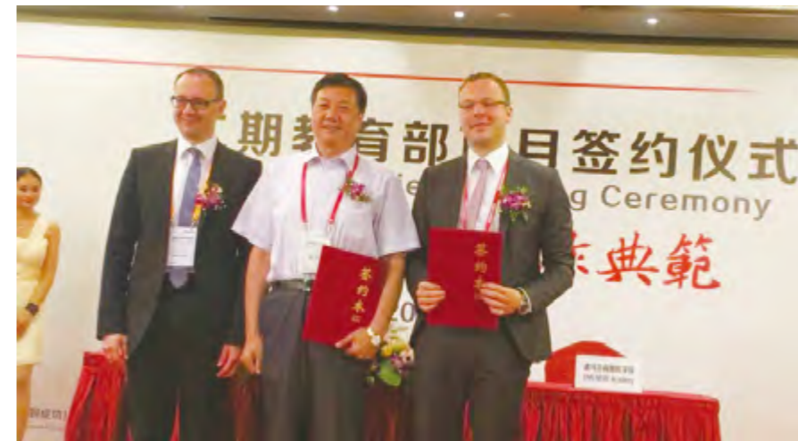
2014年7月7日,烟台工程职业技术学院签署协议成为全国DMG MS数控专业领域第二期校企合作项目首批合作院校。

教育教学工作。建立教学质量监控体系、教师教学水平评价标准和内部专业评估体系,选取11个专业试点推行一体化课程改革,对理论课堂、实践教学和教研活动进行全面督导,实施学生综合素质学分考评,建设智能化(网络)考试系统;年内获批航空服务、物联网技术应用等高职/技师专业4个,机电一体化技术获批成为山东省企校共建工科专业,立项建设院级特色专业3个、重点专业4个、教改项目11项,命名院级精品课21门。