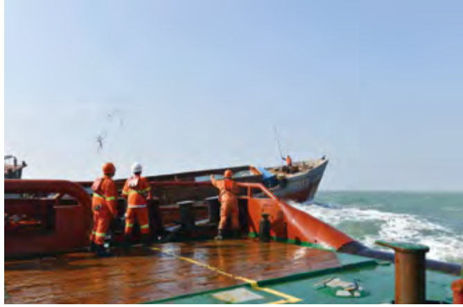
2014年12月28日,“德润”轮成功救助遇险渔船“桂防”轮。