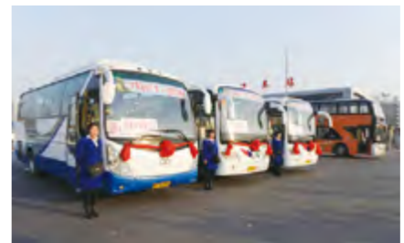
2014年3月22日，烟台首条公交旅游专线“游1路”开通。

【昆崙山旅游公交专线（游1路）】 3月22日，烟台市开通首条公交旅游专线“游1路”。该线路往返火车站与昆崙山国家森林公园之间，单程74.8公里，设站点11处，运行时间90分钟，日发4个班次。