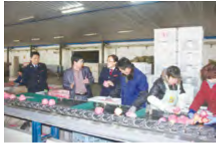
地税干部支持苹果产业发展

经济税收分析调研和税收优惠政策落实,成立1个重点产业调研组和2个重点产业对接推进组,围绕养老地产、健康服务、休闲旅游、苹果种植加工、金融等重点产业以及促进转方式调结构、推动小微企业发展等重点工作,形成多份调研报告,为政府决策