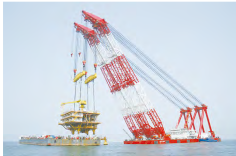
2014年7~9月,烟台打捞局完成国内首次海洋石油平台拆解。

【国内首次石油平台拆解】 7月8日至9月13日,烟台打捞局对两座石油平台进行包括平台组块、导管架及火炬臂、海管海缆、膨胀弯等一系列结构附属物的拆除、弃置、回收工作,在