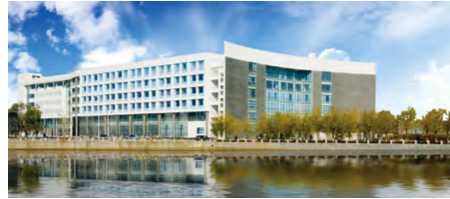
文经学院校园风光

划、落实考生志愿、进行录取工作,年度学院新增学生3586人。全年举办40多场专场招聘会,并于3月和11月举办大型招聘会,共吸引240余家省内外用人单位来校应聘,共提供各类岗位1万余个。组织申报的6个大学生创新创业训练计划项目中,4个项目获国家级立项。参加山东省创业大赛(高校赛区)暨第二届全省大学生创业大赛,获2项创业优秀奖;参加第九届“创青春”山东省大学生创业大赛,共选出11份作品参加省赛,最终10个项目获奖,1名教师被评为优秀指导老师;参加莱山区创业大赛,获得三等奖。学院严格按照国家制度,规范做好奖助学金评定工作,先后召开2012-2013学年国家奖助学金评审工作专题部署会和奖学金颁发仪式暨优良学风建设推进大会。