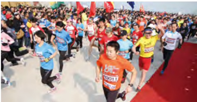
2014年3月16日，烟台市举办第十八届万人长跑活动。

【烟台市第十八届万人长跑活动】 3月16日，烟台市第十八届万人长跑活动暨开发区第十五届“农行杯”环城健步行在开发区东巡宫举行，6000多名市民参加活动。该次长跑活动分为单位方队和个人比赛两种方式。专业组全程长约12公里。业余组全程约6公里。活动由烟台市体育局、烟台经济技术开发区工委群工部主办，烟台经济技术开发区体育管理办公室，胶东在线网站、烟台市马拉松协会承办。