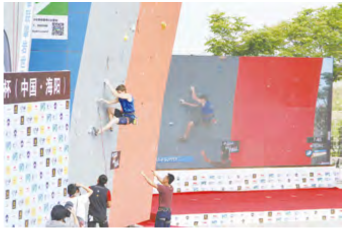
2014年6月20日，国际攀岩世界杯海阳站比赛在海阳市举行。

局、市体育局承办，烟台健友俱乐部协办，共有来自全国各地855名运动员参加各个组别的比赛。