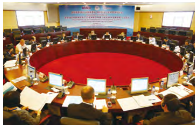
2014年5月12日,全球动议(GI)中国项目第一次会议会场。

【服务经济社会发展】 烟台海事局改革行政审批事项,清理海事规范性文件68份,废止59件。加强电子口岸建设,优化煤电油等重要物资运输“绿色通道”,审批国际航行船舶进出口岸申报2244份,办理国际航行船舶进出口岸查验手续4205艘次。支持“中华泰山”邮轮和烟台—平泽中韩客滚班轮安全运营,协调为随船人员开展培训432人次、加急办理各类证书398本。举办“海事开放日”活动,组织5批300余名留守儿童、希望小学儿童走进海事,了解海洋;开展水上交通安全知识进校园活动,1000多名师生参加;建成烟台海上安全展馆、渤海湾客滚船安全发展展室。芝罘海事