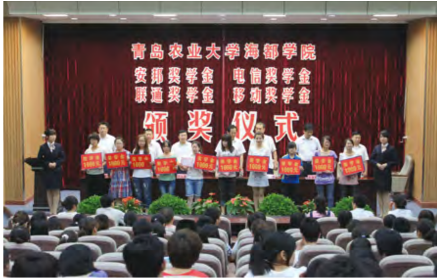
企业在青岛农业大学海都学院设立奖助学金

获2个国家级奖项，20个省级奖项，学校获“优秀组织单位”称号。参加山东省“传承文明共筑梦想”经典诵读活动，获一等奖1项，二等奖1项，三等奖3项，学校获优秀组织奖。