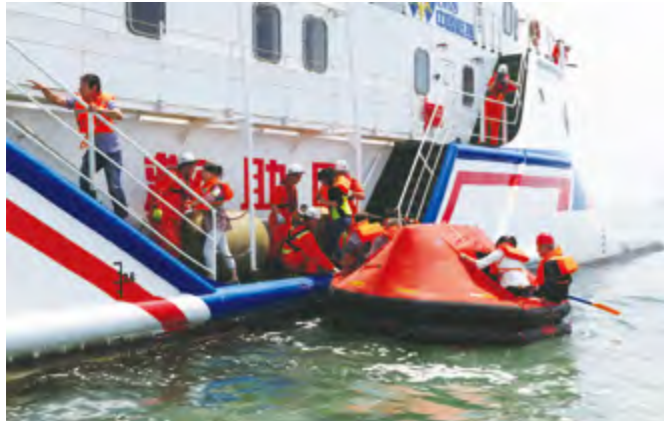
2014年6月24日,烟台海事局开展长岛环岛游客船弃船海上搜救演习。