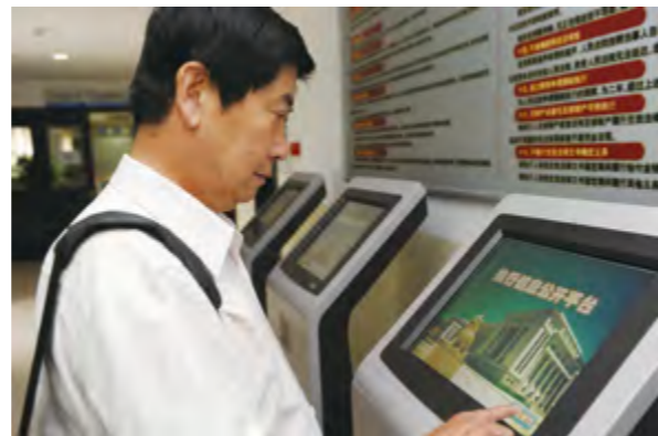
当事人在法院电子信息服务平台上查询案件信息。

【司法为民】年内,全市法院依法审结各类民事案件29577件,标的额20.2亿元。审结婚姻家庭、财产继承、相邻权等案件11598件。审结劳动争议、追索劳动报酬等案件3674件。审结农村土地承包经营权、宅基地使用权等案件177件。审结房地产开发经营、商品房预售等案件968件,规范建筑和房屋交易市场秩序。强化诉调对接和诉前调解,依法审查确认医疗纠纷、交通事故等调解协议1187件,诉前化解纠纷2719件。兑现民生权益,组织开展涉民生、涉金融案件和执行积案清理等活动,执结各类案件20590件,标的额45.6亿元。加强执行联动机制建设,与公安、工商、银行等部门合作,实现户籍、车辆等信息网上查询,限制出境38人次,限制高消费1471人次。按照最高人民法院规定,将11371名被执行人纳入失信被执行