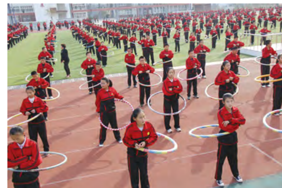
学生在大课间进行体育锻炼

【教学改革】 年内，市教育局加强对构建学校主题课程的指导和校本课程的开发，推进国家课程校本化实施，将孤立的校本课程统一起来，形成独具学校特色的课程群。深化教育教学改革，“和谐高效思维对话”型课堂建设研究、普通高中学科选层次走班教学模式、小学语文“大量读写，双轨运行”实验与研究均获得2014年基础教育国家级教学成果二等奖。推动烟台一中通过省厅审批，与加拿大派恩垂公立中学合作开办国际课程班。