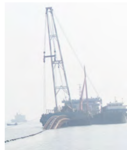
蓬长跨海引水工程

【社会生活】 2014年城镇居民人均可支配收入28165元, 人均消费性支出15251.7元。农村居民人均纯收入18466元, 增长11.3%; 人均生活消费