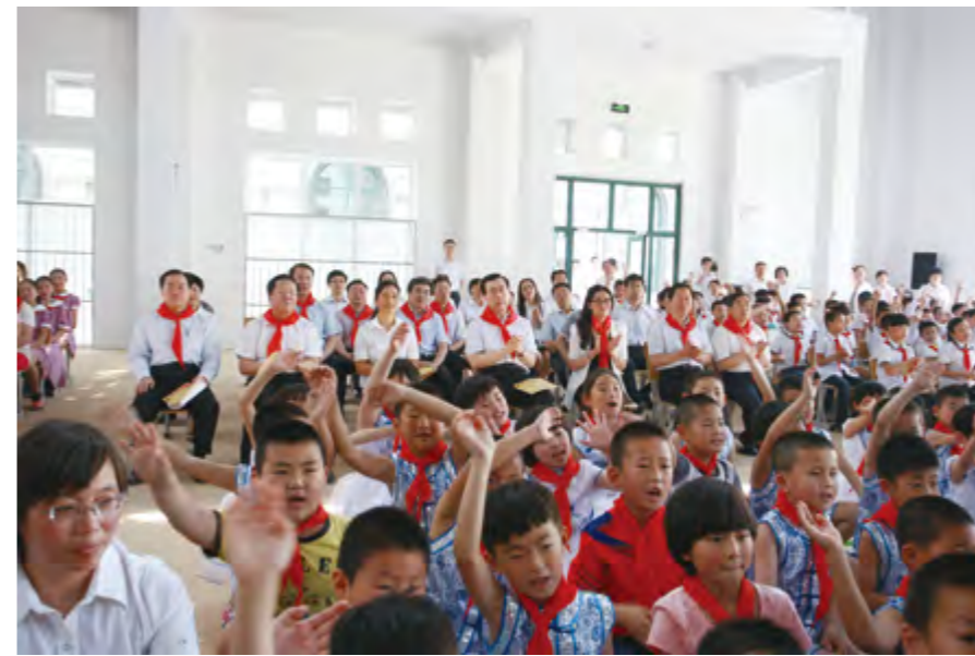
2014年5月30日，市委书记张江汀与小学生共度“六一”儿童节。

【中小学城乡均衡发展】 年内，市教育局将农村义务教育学校校舍标准化建设工程列入2014年政府为民服务实事，到年底开工建设校舍84.4万平方米，改造旱厕203个，建设食堂166个，完成年初确定的“改造开工面积将达到总体规划的65%以上，旱厕改造和食堂建设项目全部开工”的目标任务。持续推进校舍安全工程，累计投入资金近40亿元，加固、新建校舍427万平方米，中小学校舍基本达到抗震设防标准；推进“211”工程，先后投入资金3.4亿元，实现为中小学生免费热水热饭服务，80%的农村学校实现冬季取暖；推进标准化学校建设工程，259所学校达到省定标准，82所学校基本达标；推进图书馆（室）建设工程，全市中小学图书馆（室）新增各种图书152万册。年内，有6个县市区通过评估，在全省处于前列。继续实施校车工程和免费校服、午餐工程。自2011年，全市累计投入3亿多元购置和配备校车1330辆，实现农村中小学校车服务全覆盖，开发区、高新区、福山区、莱山区实现免费乘车；有12个县市区为义务教育段学生配发免费学生装；免费午餐工作正在进行试点。推进数字校园“三通两平台”（宽带网络校校通、优质资源班班通、网络学习空间人人通，教育资源公共服务平台、教育管理公共服务平台）建设，全市教育城域网出口达到