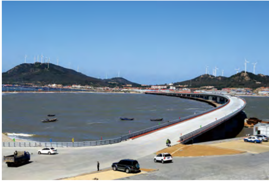
2014年9月30日, 南北长山联岛大桥竣工通车。

亿元, 增长7.9%; 第二产业增加值5.7亿元, 增长6.2%; 第三产业增加值23.4亿元, 增长4.6%。三次产业比例为57.7:8.4:33.9。全社会固定资产投资5.87亿元, 增长14.2%。实现公共财政预算收入1.17亿元, 增长11.5%。年末金融机构人民币各项存款余额38.9亿元, 比年初增加5.2亿元, 其中储蓄存款余额25.8亿元, 增加2.1亿元。人民币各项贷款余额12.6亿元, 增加0.4亿元。