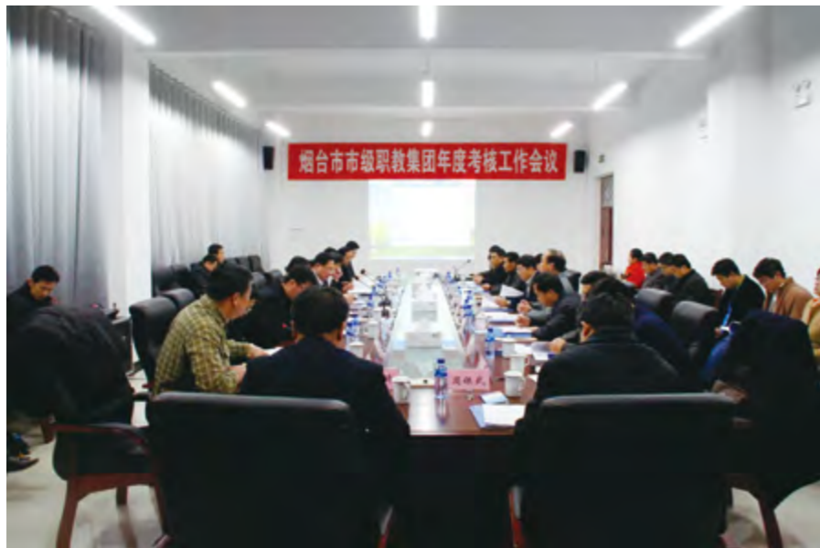
2014年12月10日,烟台市市级职教集团年度考核工作会议召开。