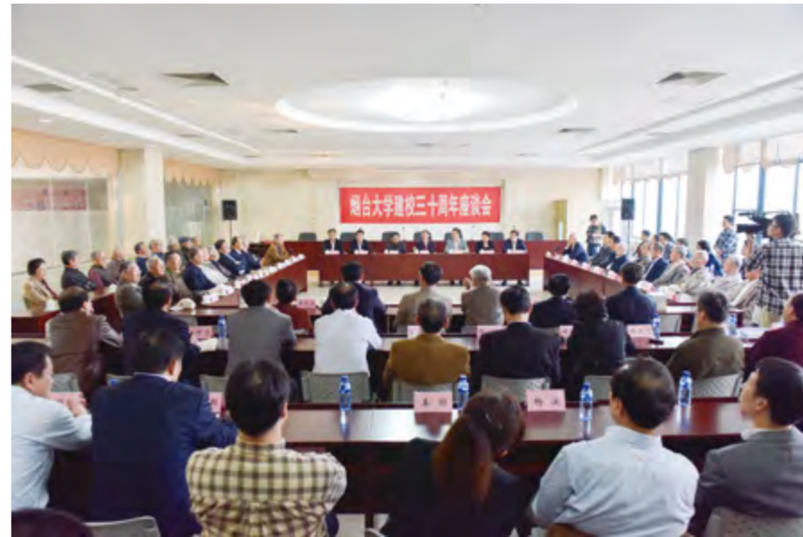
2014年10月18日,烟台大学召开建校30周年座谈会。

族问题研究中心,7个省级工程技术研究中心,1个山东省国际(港澳台)科技合作平台,1个省级研究院,1个省软科学研究基地;1个省级大学科技园。