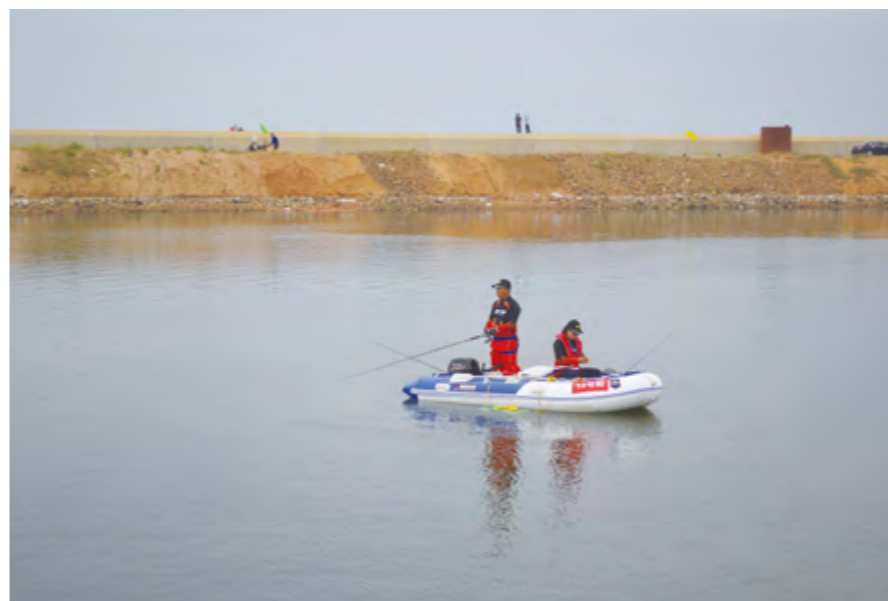
2014年10月3日,2014年全国海钓锦标赛(海阳站)暨国际海钓邀请赛在海阳旅游度假区君子连理岛开赛。图为比赛现场。

【八路军胶东军区机关旧址暨许世友将军在胶东纪念馆对外开放】 1942年7月1日,八路军胶东军区在海阳县朱吴村成立,后军区机关迁至战场泊村。至1945年8月,许世友领导下的胶东军区机关多次长时间驻扎于此,取得辉煌战绩。为发掘、保护好这一具有传奇色彩的红色文化资源,海阳市在郭城镇战场泊村修建许世友将军在胶东纪念馆,并对胶东军区机关旧址进行恢复性建设。项目总面积约2万平方米,于2013年11月筹建,2014年5月开工,10月24日完成并对外开放。许世友纪念馆占地面积2986.09平方米,建筑面积1629.93平方米,展陈面积1000.31平方米,以“军爱民”精神为主题,集中打造“传奇许世友”“军民血肉情”“胶东子弟兵”三大板块。旧址区面积10664平方米,利用