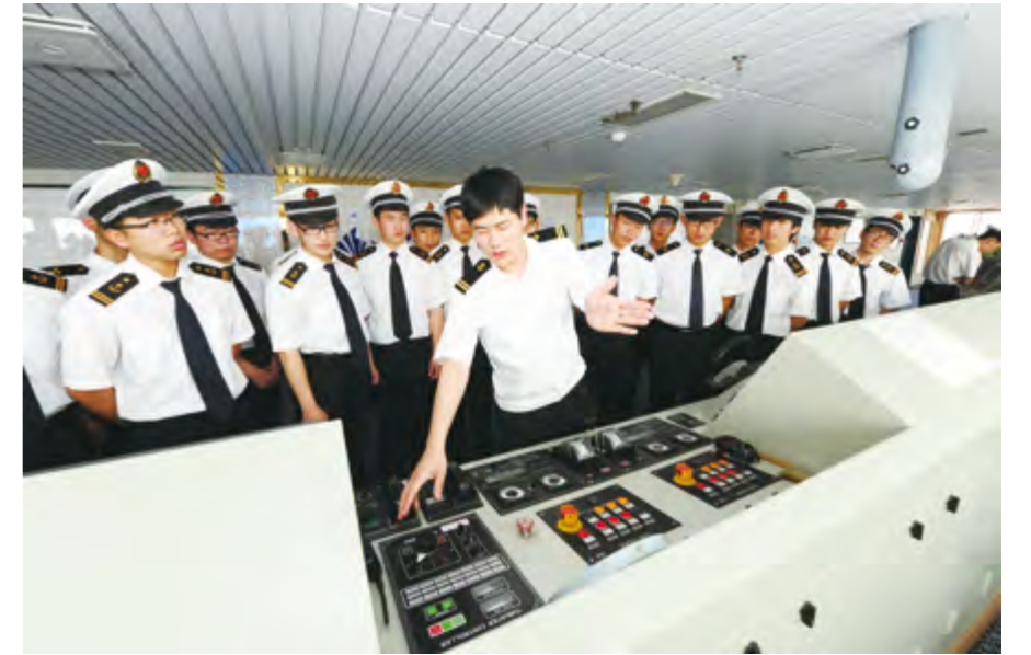
2014年6月25日，烟台大学学生在“渤海明珠”客滚船上见习。

【涉客船舶管理】 年内，烟台海事局开展客运船舶“五制五关”机制建设效果评估，完成18家客运公司、139艘客船、1352名船员防疲劳等基础情况调研。对辽鲁省际航线客滚船航行动态实施全程监控、专台值守、定时抽查。强化中韩客货班轮管理，与公司进行安全建议谈话，联合开展安全专项整治。开展蓬长水域旅游客船通航安全评价和对策研究，设置长岛到珍珠门航道以及“北上游”航线，加强安全监管，严禁超客、超载现象发