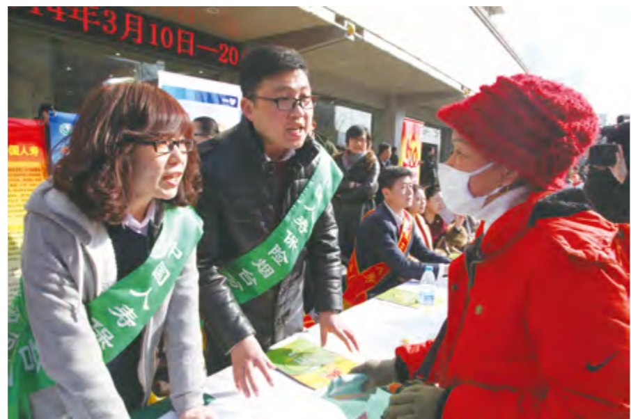
2014年3月15日,烟台保险业举办“3·15”广场宣传活动,图为某保险公司工作人员接受烟台市民咨询。

【社会贡献】 年内,烟台保监局与烟台保险行业协会、山东工商学院统计学院共同建立人才培养和交流合作机制,在2014年举办的保险业专场招聘会中,30家公司为大学生提供就业岗位400余个。2014年,保险业缴