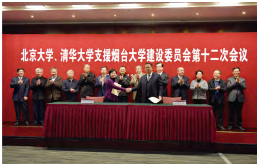
2014年11月26日,北京大学、清华大学支援烟台大学建设委员会第十二次会议在北京大学召开。图为烟台大学与北京大学签订合作协议。

学校有1个“服务国家特殊需求博士人才培养项目”,16个硕士学位授权一级学科,7个硕士专业学位授权类别,涵盖142个硕士招生专业(领域)。7个省级重点学科,1个省部共建教育部重点实验室,1个山东省高等学校协同创新中心,8个省级重点实验室,1个国家民委民族理论政策研究基地,1个国家知识产权培训基地,2个国家技术转移中心,1个强化建设山东省高校人文社科研究基地,1个山东省民