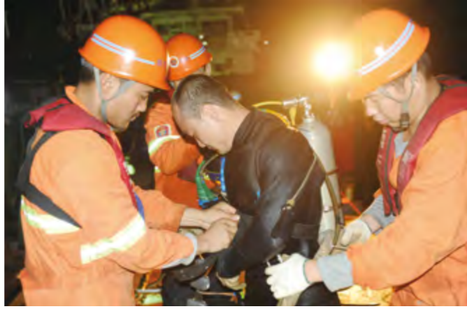
2014年3月24日,烟台打捞局完成港珠澳大桥潜水服务作业任务。

投资建设5000吨打捞起重船、两艘2万吨自航甲板船;购置最大作业深度不小于3000米的水下作业车及开孔设备(ROV);2万吨级干船坞投入试运营;救捞浮筒基地改造工程将于2015年5月投入使用;溢油应急及抢险打捞设备库工程获交通运输部工可批复。