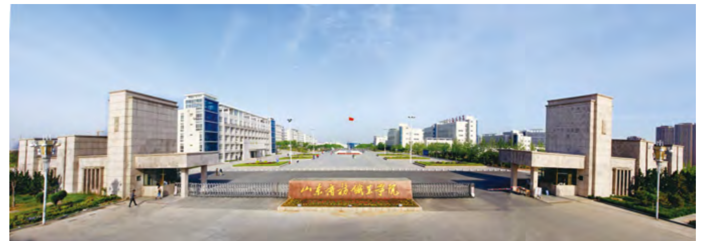
山东商务职业学院

专业建设。烹饪专业是学院的龙头专业,被省人力资源和社会保障厅评为省级重点专业,学院被中国烹