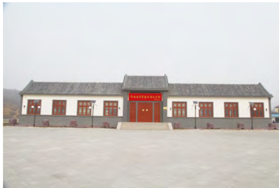
2014年10月24日,八路军胶东军区机关旧址恢复性建设在海阳市完成并对外开放。