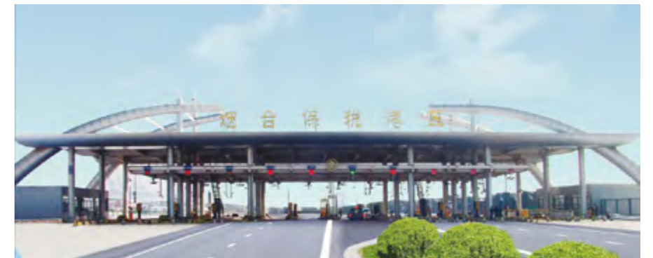
烟台保税港区卡口