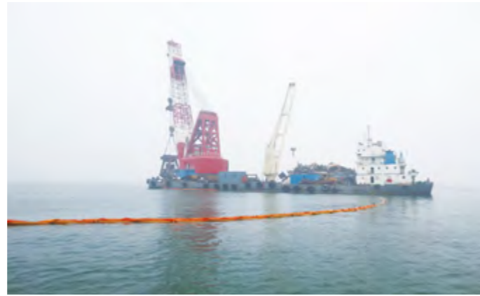
2014年6月17日,烟台海事局在进行“兴龙舟65”沉船打捞时指导布设围油栏。

线客滚船弃船岸联合演习、长岛环岛游客船弃船海上搜救演习、中韩客货班轮三方桌面搜救推演,参加2014烟台港航联合反恐消防综合演练,举办年度海上搜救业务培训。有效应对台风“麦德姆”、冬季寒潮大风等极端恶劣天气。发布大风预警信息43期,成功处置险情29起;组织搜救行动30起,救起182人,人命救助成功率95.3%。