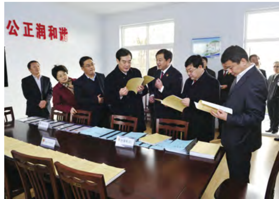
2014年12月2~4日,省院党组书记、检察长吴鹏飞(中)来烟视察调研。

【维稳工作】 年内,市检察院共批捕刑事犯罪嫌疑人3314人、起诉5785人。参与打黑除恶专项斗争,批捕黑恶势力犯罪、暴力犯罪、黄赌毒犯罪等598人、起诉693人。参与打击涉众型经济犯罪专项行动,依法办理非法吸收公众存款、集资诈骗、非法传销等犯罪72件。推行风险评估预警制度,做到每案必评估、矛盾早化解,排查化解各类风险306件。完善刑事和解、检调对接等制度,依法对467名犯罪情节轻微的初犯、偶犯等作出不捕不诉决定,促成刑事和解225件。推进涉法涉诉信访改革,妥善处理群众信访3991件,继续保持无涉检到省进京访。创新推行检察宣告制度,针对某些案件当事人对不起诉、不抗诉等检察决定不理解的问题,改变过去送达