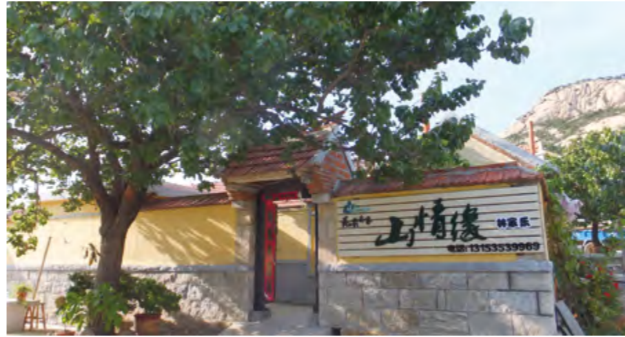
2014年9月，桃源农家乐生态旅游村对外营业。

【森林防火】 年内，保护区利用明白纸、横幅、手机短信、微信、网络、扩音喇叭等手段进行防火宣传。组织机关干部进村入户，与群众一对