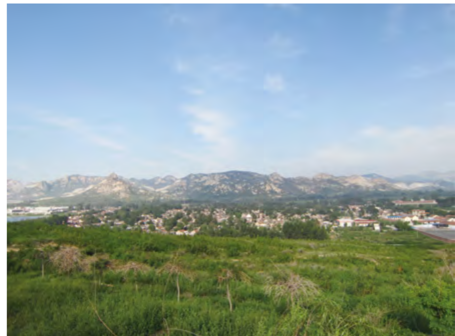
中国传统村落——北栾家河村貌

高家庄子村现存传统建筑主体为清代中晚期以来的民居院落，除建于1820年代的乾隆末年御前侍卫徐云峰故居及其附近几组旧宅外，大部分建于清光绪年间的1870~1890年。139栋建于1870~1910年之间，44栋建于1911~1928年之间，清朝民建占70%以上。村中保存基本完好的传统民居院落186套。是山东省内规模最大、保存格局最为完整、各类型历史建筑最为齐全的古村落之一，具有突出的传统村落景观风貌和历史文化内涵。传统民居建筑保存众多，宗祠、庙宇、古树、城墙、护城河等公共建筑和风景名胜也较为丰富，传统方形城池和鱼骨状“进甬”街巷格局十分完整，街巷风貌良好、村落中心节点突出，是传统城池和家族聚居型村落建设的典型遗存。古民居蕴含着丰富的传统建筑技术，既体现了宋元时期胶东建筑技术的传统渊源，又见证了近代以来与北京官式建筑技术的交流。村落建设和建筑细部所蕴含的历史文化内