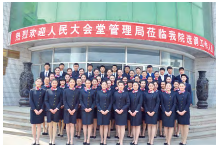
人民大会堂先后八次组织人员到烟台工贸技师学院选聘学生百余名。

学校是山东省技能型人才培养特色名校、国家中医药管理局重点建设院校、国家中医药管理局职业技能鉴定中心、乡村医生学历教育基地、全国中医药职业技术教育学会副理事长单位。先后获国家中医药管理局中医药教育先进集体、山东省学习型先进单位、省级卫生先进单位、山东省医学教育工作先进集体、山东省中医工作先进集体、山东省文明单位等称号。