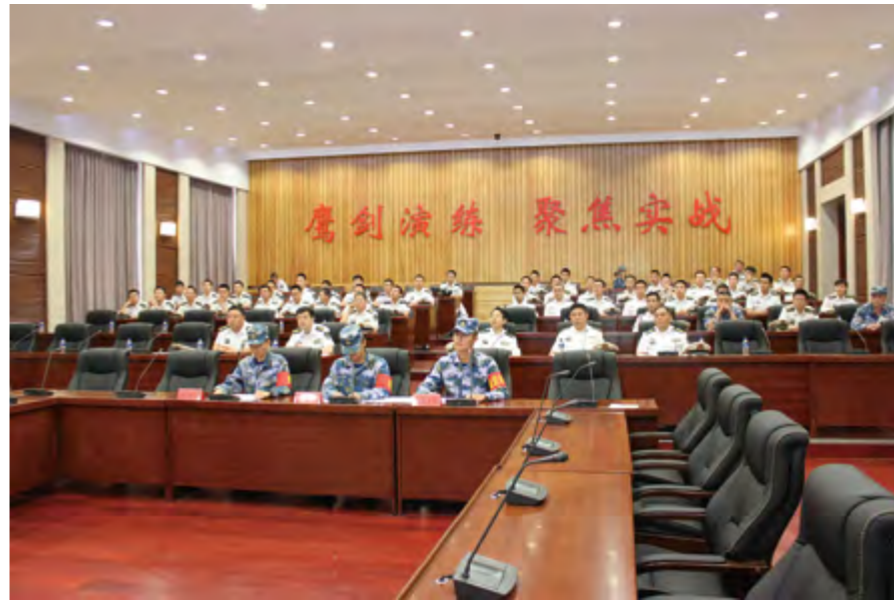
2014年6月6日,海军航空工程学院毕业学员综合演练。

2014年,全院完成600余个专业班次、20万余学时、17900余人次的承训任务。教学成果获全国一、二等奖各1项,科研成果获军队科技进步奖38项(一等奖3项),第八届国际发明展览会金奖2项、银奖和专项奖各1项。学员