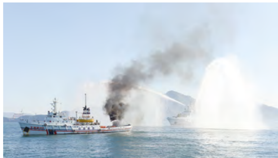
2014年9月11日，北海救助局、烟台打捞局、北海第一救助飞行队在烟台外锚地举行“2014年救捞系统应急救援演练”。

日，北海救助局首次采取“无脚本”形式，在烟台港内锚地举行“2014年度北部海域海上专业救助力量春运保障船岸应急演练”，完成恶劣天气损害、失控、触礁、弃船、搜救弃船人员等5个演习科目。