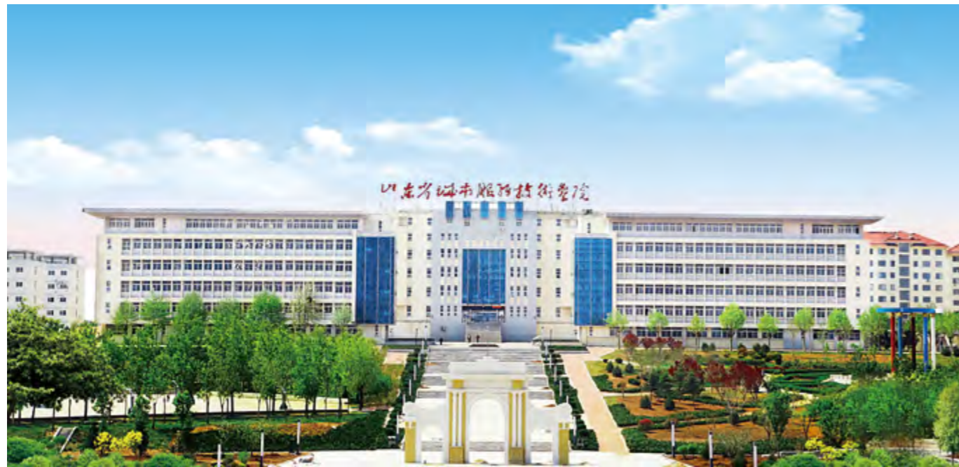
山东省城市服务技术学院

饪协会、山东省烹饪协会联合命名为“中国烹饪学府”。拥有现代化标准实验实训楼，总建筑面积1.5万余平方米，设有标准、先进的演示、实训室24个，配有电子评判、电子监控、电视网络系统等教学设备，曾多次承办国家、省、市级烹饪大赛。学院烹饪专业“双师型”教师达到100%。酒店管理专业拥有客房实训室、茶艺室、模拟前厅实训室、形体训练室等10多个实验实训室，拥有专兼职教师23人，其中高级职称16人，“双师型”教师14人，高级技师6人，全国技术能手2人，国家职业技能鉴定考评员8人。学院新上暖通、形象设计、茶艺、汽车技术服务与营销四个专业。烹饪、饭店服务与管理、电子商务三个专业被中国商业联合会评为特色品牌专业。