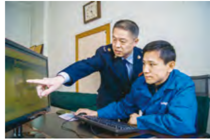
地税干部登门辅导纳税人网上报税

统、24小时自助服务系统,向纳税人推广应用网开发票系统。推行“一窗全能”服务,改变办税服务厅原有的税务登记、发票领购、纳税申报等分类设置服务窗口方式,将职责单一的窗口整合改为全能窗口。推行午间轮值、延时服务等措施,全市办税服务厅实现工作日“无间断”服务。