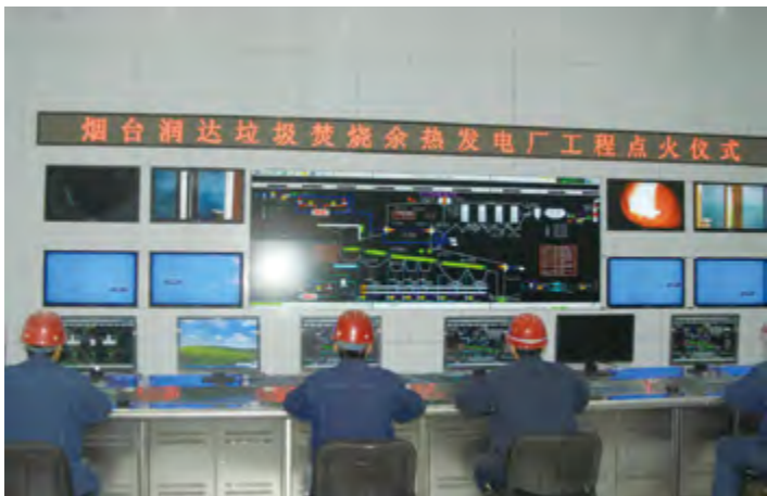
生活垃圾综合湿解二期工程

【供气保障】 年内，市城管局督导燃气企业落实新建住宅配套设施建设，保障燃气供应，全市新增天然气用户7.6万户。提请市政府专题部署燃气灰口铸铁管改造，年度完成74公里，累计完成128.6公里。开展烟中大厦燃气设施隐患整改，协调推进管道液化气小区置换，置换超期未检或超期服役液化气钢瓶10万只，报废处理5万只。开展液化气市场整治，对13个液化气站、52个瓶组气化站进行安全检查，查处3处液化气非法经营点。开展燃气行业“六打六治”打非治违专