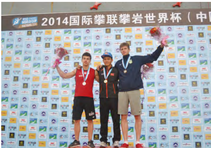
2014年6月22日,在山东海阳举办的2014国际攀联攀岩世界杯男子速度决赛中,中国选手钟齐鑫以6秒03的成绩夺得冠军。

【社会生活】 2014年城镇居民人均可支配收入34190元,增长9%;人均消费性支出19802元,增长14.1%;人均住房建筑面积30.7平方米。农村居民人均纯收入16033元,增长12.1%;人均生活消费支出7584元;人均住房面积34.3平方米。全市城镇基本养老、