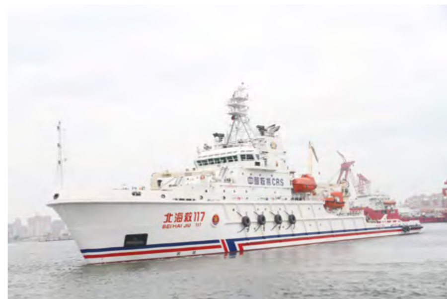
2014年7月9日，国内首艘具有破冰功能的专业救助船“北海救117”轮正式列编北海救助局。

【2014年船岸联合应急演练暨国庆保障应急救援演练】 9月29日，北海救助局在烟台锚地举行该演练，为节