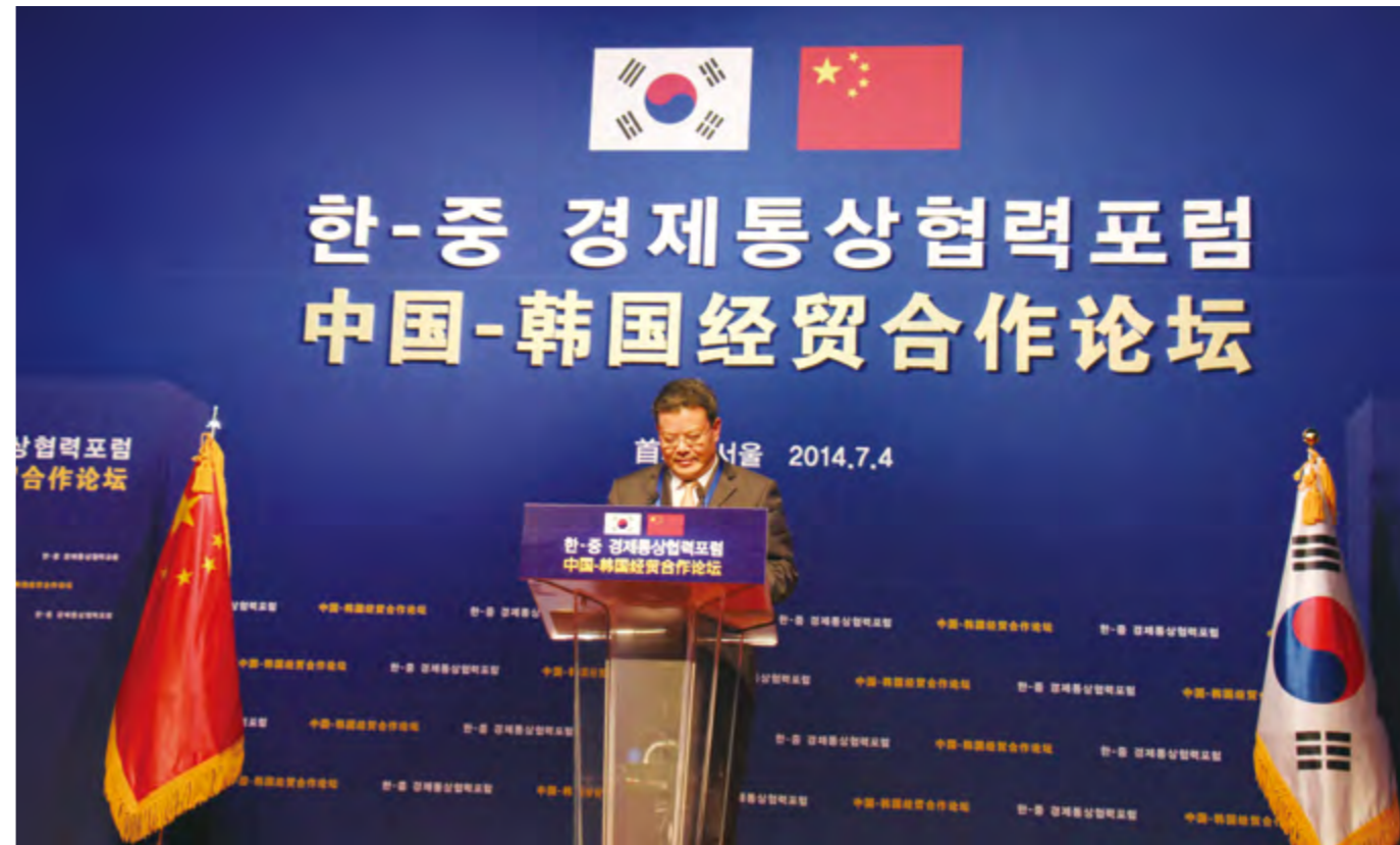
2014年7月4日,烟台市长孟凡利参加由中韩两国政府联合举办的“中国-韩国经贸合作论坛”,并作了题为《深化中韩地方经济合作 携手推动区域繁荣发展》的主旨演讲。

招大引强。11月28~29日,市商务局、市投资促进局举办2014跨国公司驻华总部高管烟台行活动,邀请世界知名跨国公司驻华高管约50人来烟实地考察投资环境,洽谈合作项目。年内,与日本三菱东京日联银行、三菱商事、德国水务、韩国韩华集团签署战略合作框架协议,累计已与10家知名跨国公司签署战略合作协议。