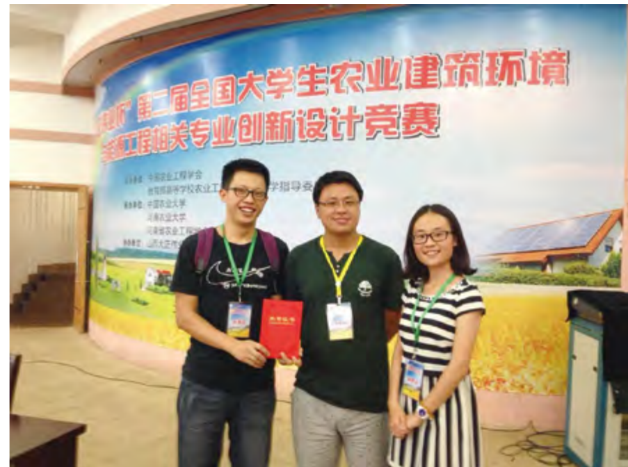
2014年8月12日, 在第二届全国大学生农业建筑环境与能源工程相关专业创新设计竞赛中, 中国农业大学烟台研究院选派的两支参赛团队获得特等奖和二等奖各1项。

学生教育与管理。建立、健全学院、辅导员和班主任评价考核体系, 修订完善学生工作考核评估办法, 建立领导干部联系学生班级制度, 加大对违纪学生的教育与管理。完善大学