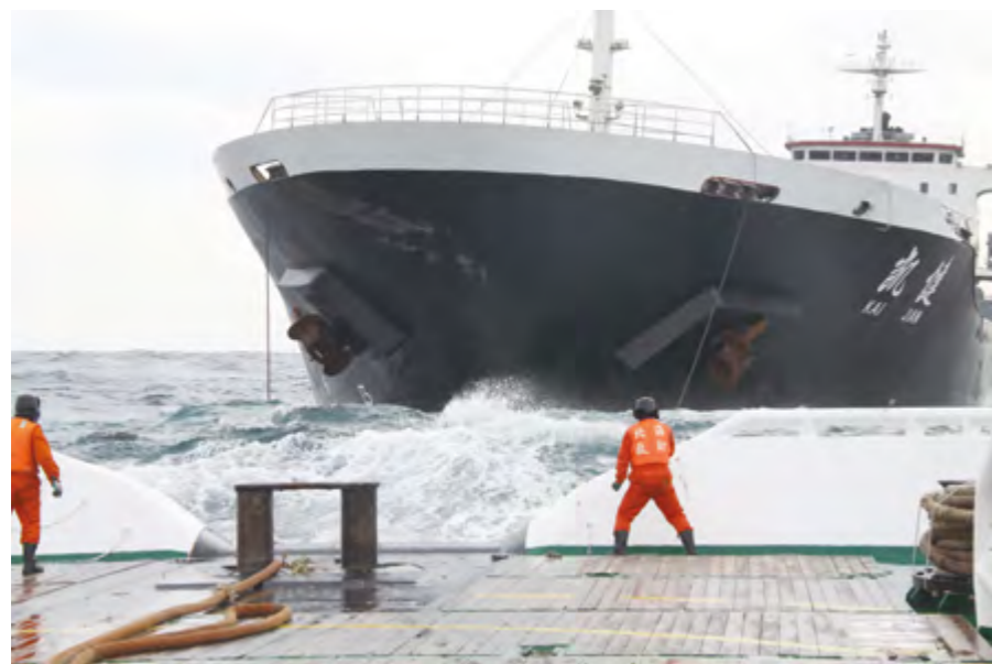
2014年12月7日，“北海救112”轮、“北海救115”轮在石岛东南105海里处救助主机失控的“凯健”轮及23名遇险船员。

域联合救助翻扣船“金星19”轮上6名失踪人员。9月23日，“北海救117”轮在大连海洋岛以西4海里处，成功救助载柴油600吨机舱失火的油船“功达油1”轮。10月10日，“北海救101”轮在石岛南95海里处，成功救助主机故障“鑫中远”轮及16名船员。11月27日，“北海救116”轮在石岛东南22海里处，成功救助相撞中国籍货船“中凯旺”轮和外籍散货船“MEGAHOPE”轮，44名遇险人员获救。12月1日，“北海救116”轮在8-9级10级大风恶劣海况下，在成山头东35海里处，用救生吊篮分4次将“辽大金渔85080”轮上5名遇险渔民救起。12月1日，“北海救199”轮、救助直升机“B7313”在长岛锚地救助船舱进水的货船“津滨快航18”轮及船上10名遇险船员。12月3日，“北海救117”轮和直升机“B7312”在遇岩西北2海里处救助1艘无名木质渔船及船上9名遇险人员。12月3日，“北海救101”轮、“北海救108”轮和救助直升机“B7313”在烟台东北37海里处救助翻沉砂石船上4名遇险人员。12月7日，“北海救112”轮、“北海救