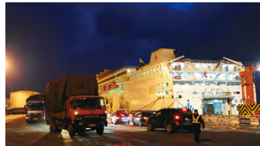
2014年1月21日，烟台海事局加强风后复航客滚船的安全监管。

【水上安全监管】 年内，市政府召开全市“平安海区”创建暨冬季海上安全工作会议，统筹开展百日攻坚、安全资质、雾季监管、“六打六治”打非治违等专项行动。烟台海事局开展船舶现场检查9579艘次，船舶安检966艘次，发现缺陷6257项；审批船舶载运危险货物申报5273艘次，检查危险品船舶1410艘次、查处违章306起，船舶防污染检查1180艘次、纠正违章271起；实施行政处罚160件。开展商渔船防碰撞安全警示教育，联合地方政府清除碍航网具，划定烟台至威海近岸航路，打捞清除沉船2艘。VTS监控船舶14万艘次，发现违法行为254起，避免险情243起。组织空中巡视4次、船艇巡航56692海里，发布航行通/警告2309次。年内，辖区发生水上交通事故7起，死亡失踪4人，沉船2艘，直接经济损失350万元，同比分别下降22%、91%、67%和77%。