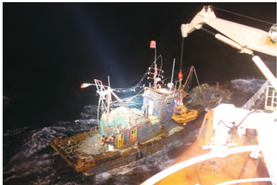
2014年12月1日，“北海救116”轮在8-9级10级大风恶劣海况下，将“辽大金渔85080”轮上5名遇险渔民救起。

【海上救助】 7月26日，“北海救112”轮在龙眼港附近，成功救助倾斜进水货船“威龙5”轮的14名船员。8月4日，“北海救112”轮、“北海救203”轮在石岛东22海里处，成功救助碰撞进水货船“金泰66”轮和渔船“中远渔2号”及43名遇险船员。9月3日，“北海救116”轮、“北海救199”轮、烟台应急反应救助队、秦皇岛应急反应救助分队与直升机“B7309”“B7312”在曹妃甸附近海