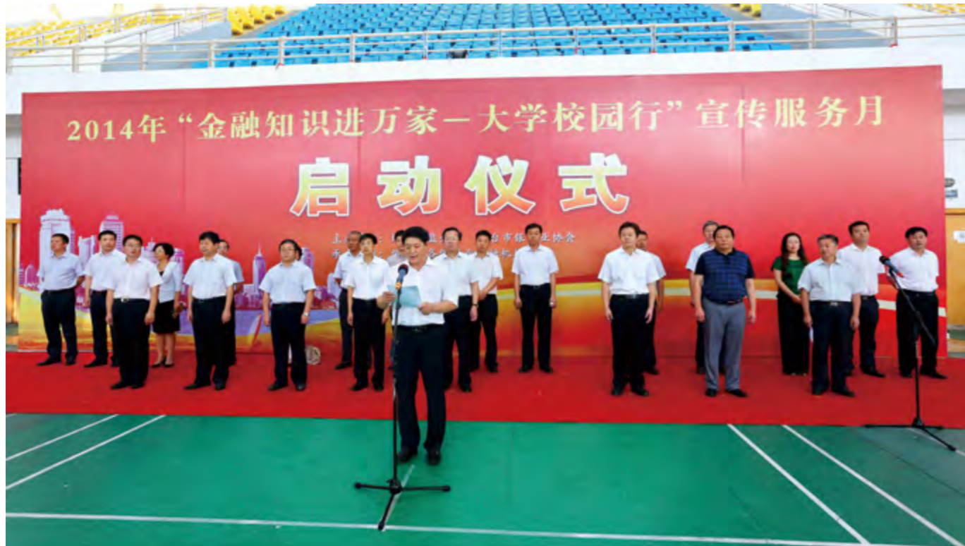
“金融知识进万家”宣传活动