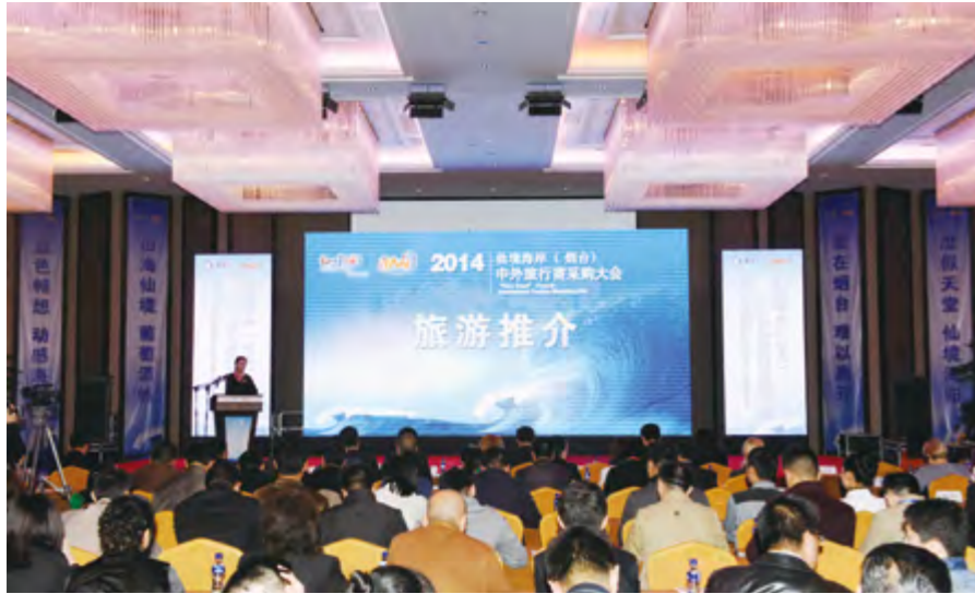
10月30日，“2014仙境海岸(烟台)中外旅行商采购大会”在海阳旅游度假区开幕。