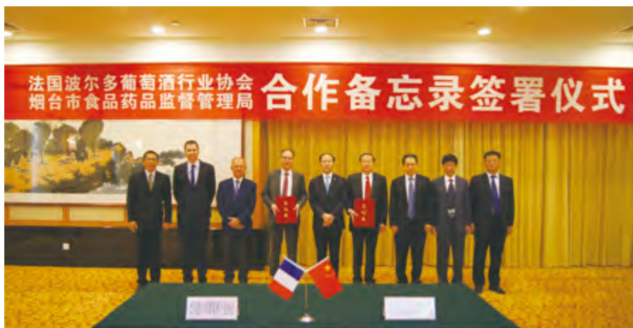
2014年11月26日，烟台市食品药品监督管理局与法国波尔多葡萄酒行业协会签署合作备忘录。

【食品安全监管】 12月31日，市政府办公室印发《烟台市创建国家食品安全城市工作实施方案》，成立由市委副书记、市长孟凡利为组长的