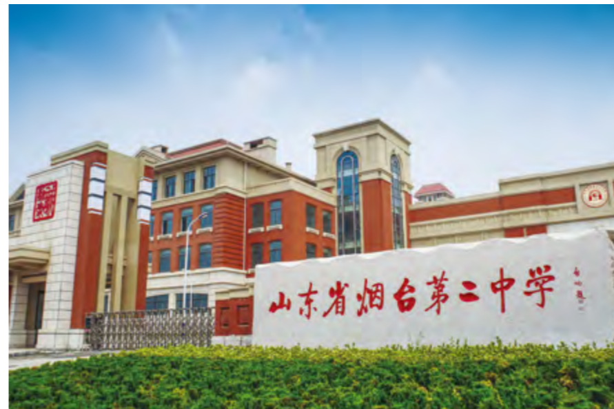
2014年8月19日,烟台二中新校区投入使用并面向六区招收高中学生。

编制县域学前教育布局规划(2014-2016),培植新增38所市级示范幼儿园,133所乡镇公办中心幼儿园交付使用。在农村,发挥乡镇公办中心幼儿园作用,推行“镇村一体化管理”办园模式,10个县市区91个乡镇(街道)基本实现“镇村一体化”办园模式,6.3万名幼儿受益。在城区,以县市区实验幼儿园为依托,推行“集团化办园”模式,福山、牟平、开发、海阳、龙口、招远、莱州等7个县市区的实验幼儿园和部分公办幼儿园在集团化办园改革上取得突破,在住宅小区举办分园。出台新的《烟台市各类幼儿园评估标准》,将烟台市一类幼儿园评估权限下放至县市区。加强对幼儿园的分类管理和动态管理,对282所省级、市级示范幼儿园进行首次复评。贯彻落实新颁布的《3-6岁儿童学习与发展指南》和《山东省学前教育规定》,组织部分省级示范幼儿园面向全市开放,对全市幼儿名师和骨干园长进行集中培训,开展全市幼儿教师优质课评比、优师送教下乡和幼儿园区域活动视频展评等系列教研活动,全市各类幼儿园“小学化”现象明显减轻。全市学前三年幼儿入园普