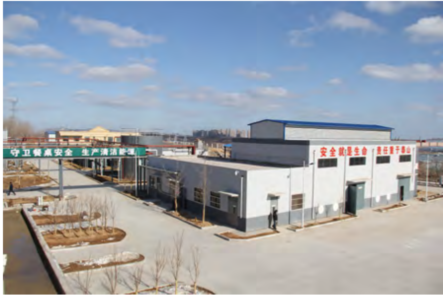
餐厨垃圾处理工程

理车辆粘带撒漏638起，清理整治露天烧烤摊点4600处，开展公用事业执法121件。