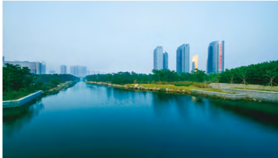
综合整治后的高新区通海西河

园、电信科技大厦等一批项目成方连片建设建成；推进旧村改造项目，滨河花苑、龙山海景等10个旧村改造项目开工200万平方米、竣工110万平方米。烟台高新区入选全省首批4个绿色生态示范城区和全国首批中德低碳生态示范城市。