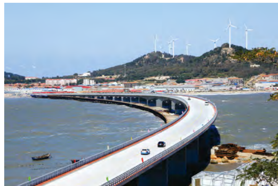
长岛南北长山大桥

经市公路部门争取,省里共批复烟台市2015年普通国道大中修项目8个,省财政安排5.4亿元,占全省的11.1%;批复烟台市5个高速公路大中修项目,总投资2.67亿元,约占全省的17.3%,项目数量和投资规模都居全省第一。争取省马龙公司支持,拟于