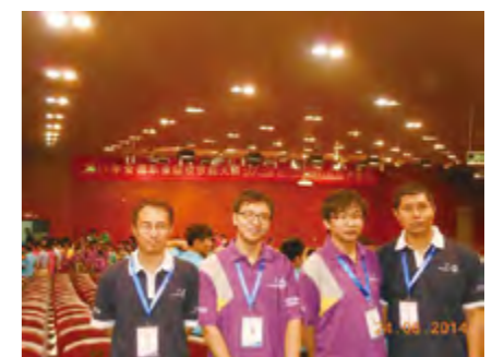
2014年6月24日,烟台工程职业技术学院师生参加2014年全国职业院校技能大赛获国家三等奖。

育人成果。年内,全院师生参加各类大赛42项,参赛人数422人次,获国家级奖项16项(技能大赛10项)、省级奖项58项(技能大赛22项)、市级奖项54项。其中,学生获全国大赛二等奖5项,三等奖5项;学生代表烟台参加山东省第二十三届运动会乒乓球决赛获1金六银,实现烟台市在省运会项目金牌零的突破。学院获评“烟台市文明单位”“烟台市教育系统先进集体”“烟台市市级公共机构节能工作先进单位”,学院团委获评“烟台市共青团工作红旗团委”,学院校卫队获评“全省先进校(护)卫队”。