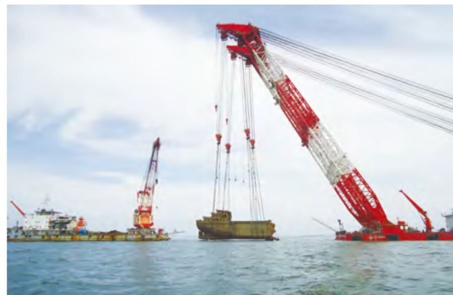
“碧海行动”——“融航机6988”进行公益性打捞