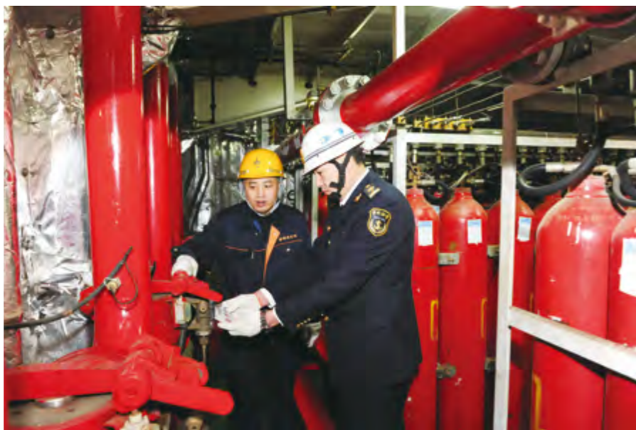
2014年12月30日，烟台海事局开展船舶安全检查。

【科技工作】 年内，烟台检验检疫局申报山东出入境检验检疫局科研项目8项、国家质检总局科研项目4项，获山东出入境检验检疫局立项2项。